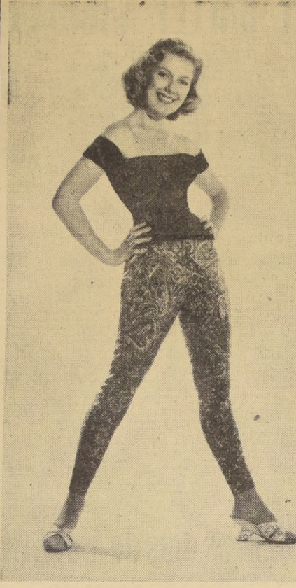
SUSAN BEAUMONT no necesita de presentaciones especiales. Basta una mirada a su fotografía para apreciar la gracia y simpatía de esta notable estrella de la pantalla argentina.