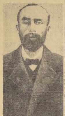
ANDRÉ DESIRÉ LANDRÚ, in dividuo misterioso, de nombres y domicilios múltiples. Se le conocía con el apodo de Moderno Barba Azul, a raíz de haberse demostrado que hizo desaparecer por lo menos a 12 mujeres, se ducidas por él y llevadas enganosamente a una villa en Gambia, próxima al bosque de Ramboillet.

Llegado Landrú a Buenos Aires—según el relato de Grock—, gracias a la pensión vitalicia del Gobierno francés, se instaló en una bonita casa de los alrededores de la capital, junto a su mujer, que se reunió muy pronto con él y vivió sin ser jamás molestado con el respetable e incensurado nombre de Jean Barbier.