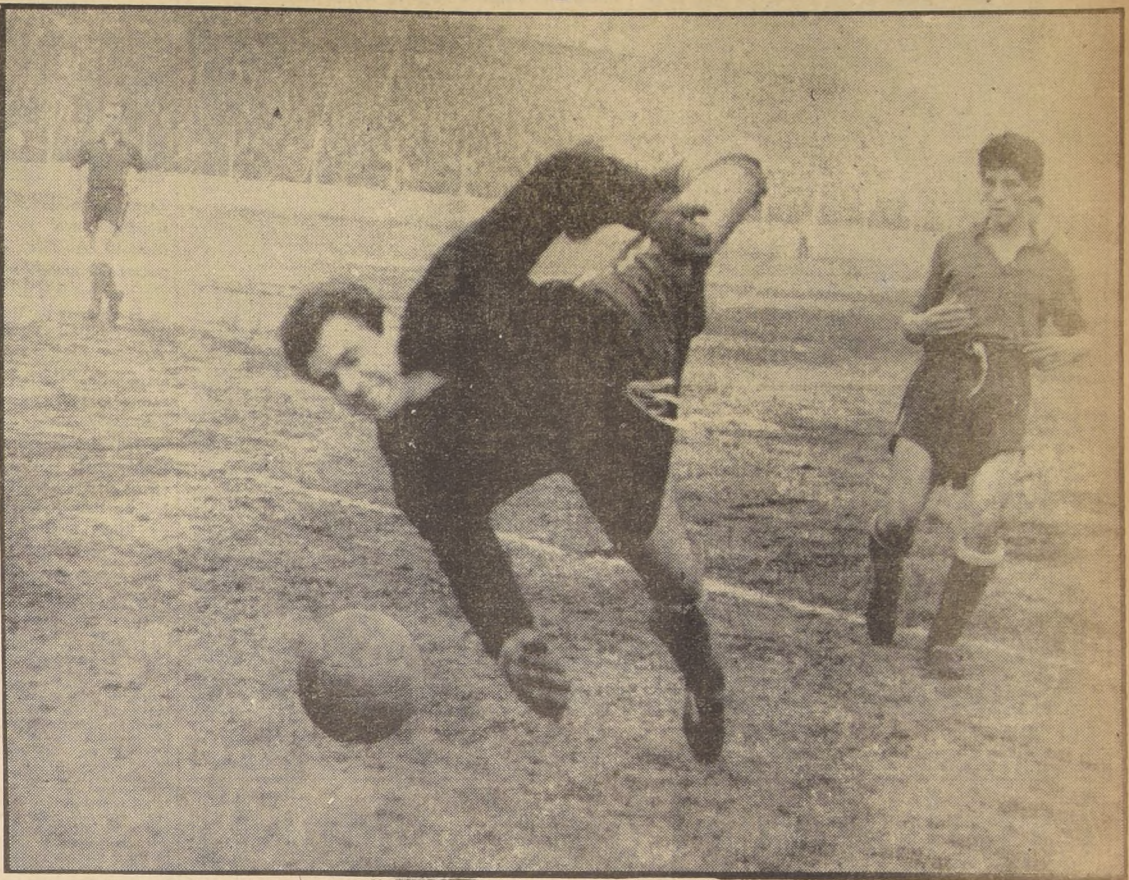
SESION DE LA FIFA.-