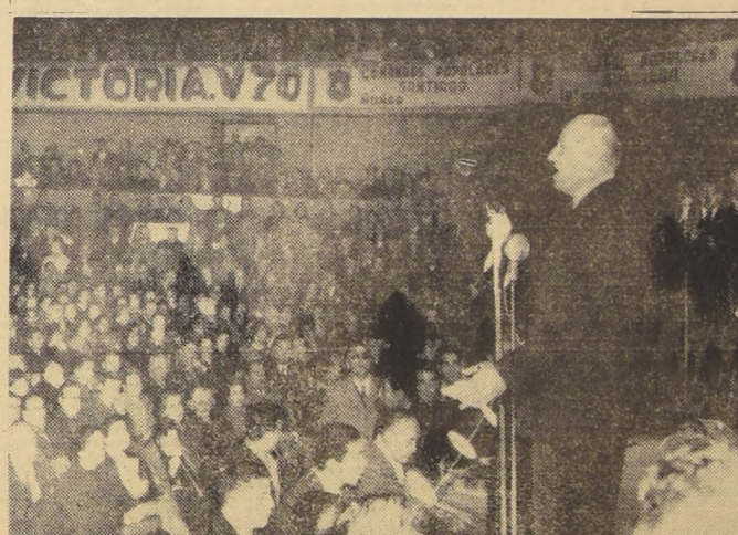
A teatro lleno y con algunos centenares de personas que no pudieron entrar al Caupolicán, fue proclamado ayer entusiastamente, el candidato presidencial de los Partidos Liberal y Conservador, don Jorge Alessandri Rodríguez. El grabado muestra sólo un aspecto de la concentración, a la que precedió un desfile de los partidarios del señor Alessandri, por las calles céntricas de Santiago, en los momentos en que habla el abanderado de la Derecha.