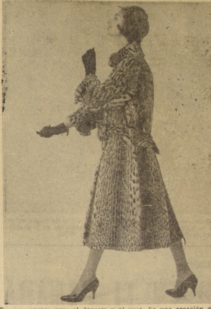
Práctico abrigo para el deporte y el auto. Es una creación de la Casa CANADA FURS, Paris, en ocelot, Gorrillo de gamuza café.