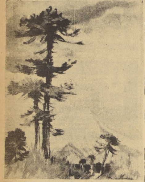
Continúa abierta la exposición de acuarelas del conocido pintor Kurt Schicketanz. La sala se ha visto concurrida por un numeroso selecto público, ansioso de conocer los paisajes y marinas del Norte Grande Chileno, que este artista ha sabido captar en toda su majestuosidad y belleza. Exhibe, asimismo, trabajos de alto mérito captados en el sur del país. La exposición se efectúa en la Sala Previsión del Banco de Chile, (San Antonio 327, subterráneo), pudiendo visitarse de 10 a 13 y de 16 a 21 horas.