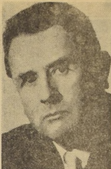
DIRIGIRA CON LA FILARMONICA - El prestigioso conductor orquestal alemán Gustav Konig, que tendrá a su cargo la conducción de los dos últimos conciertos de la Orquesta Filarmonica de Chile.

ALAMBA - R.: El quinteto de la muerte, Los secretos del capitán Holland. ALCAZAR - R.: El hombre de las mil caras, Palabras al viento.