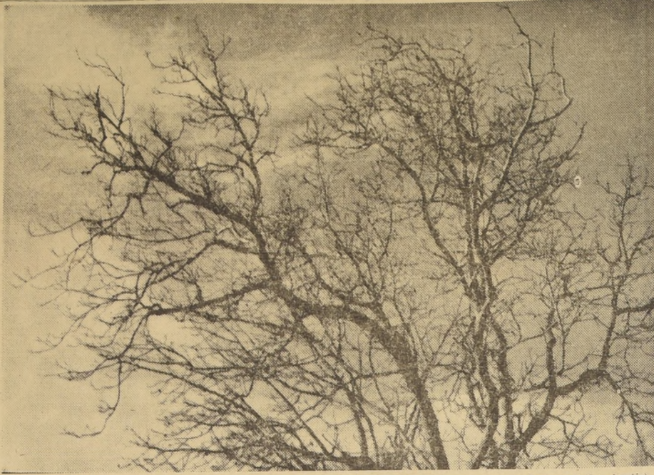
"INVIERNO EN LA RINCONADA", Fondo experimental de la Universidad de Chile.