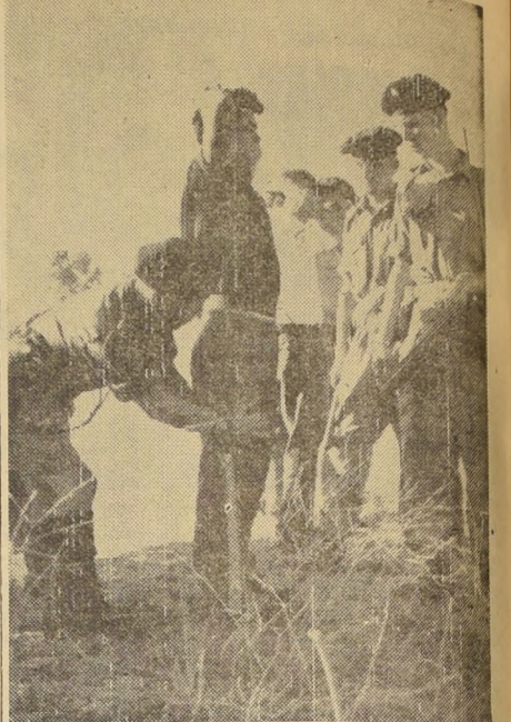
CHIPRE.— Campesinos chipriotas griegos son registrados por soldados ingleses al regresar de sus faenas el 7 del presente. Los registros fueron motivados por una refriega entre ingleses y alemanes, en la cual murieron 2 personas y otros 38 — 22 soldados entre ellas— resultaron heridos.