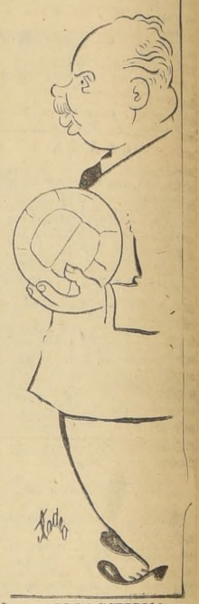
DR. CARLOS DITTBORN, presidente de la Federación de Fútbol de Chile y del Comité Organizador del Campeonato Mundial, que se efectuará en nuestro país en 1962, y que recién ha regresado de Suecia, en donde logró la más amplia ratificación a este privilegio concedido a Chile. Es la tercera vez que un campeonato de esta naturaleza lo organiza un país sudamericano. Antes que Chile, lo hicieron Uruguay, en 1930, y Brasil, en 1950.