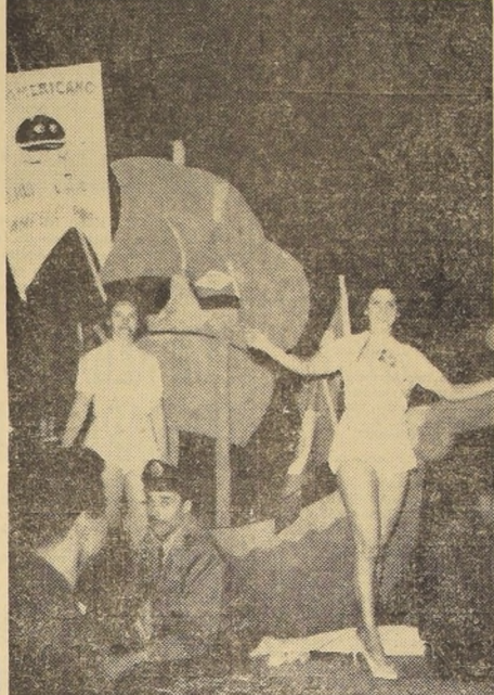
SAO PAULO PESLEJA A LOS CAMPEONES. — También la ciudad de Sao Paulo vibró a la llegada de varios de los integrantes del equipo que conquistó el título de Campeón Mundial de Fútbol, en Suecia. Hubo carnaval y corso por las avenidas principales, con vistosos carros alegóricos, como el que se observa en el grabado.

La gran carrera del domingo próximo será precedida por las obligatorias pruebas del sábado.