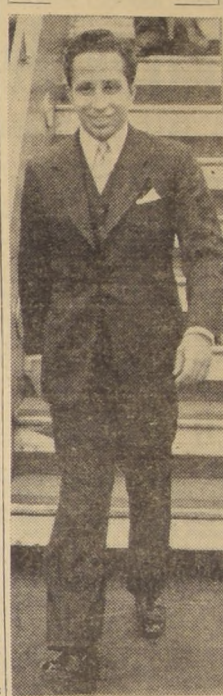
El joven monarca iraquí de 23 años de edad, Feisal, cuya suerte se ignora. Sin embargo, en todos los círculos se estima que fue una de las primeras víctimas de la rebelión que ayer conmovió al mundo.