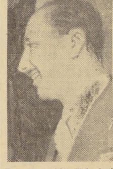
El príncipe Abdul Illah, de 45 años de edad, tío del Rey Feisal que habría muerto asesinado por las turbas rebeldes.