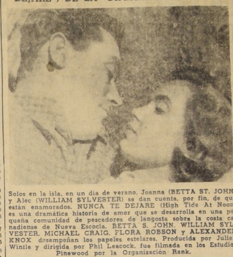
Solos en la isla, en un día de verano, Joanna (BETTA ST. JOHN) y Alec (WILLIAM SYLVESTER) se dan cuenta, por fin, de que están enamorados.

NOTA: El clásico "Tanteo de Pórcancas" se correrá como carrera A, por lo tanto, los jinetes que contratan montas para esta carrera no podrán hacerlo para la primera serie del Premio Meyer.