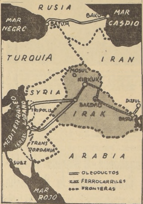
La revuelta que derrocó al Rey Feisal, cuya suerte se desconoce, ha creado en el Cercano Oriente una situación internacional de gravísimos contornos. La caída del régimen de Feisal aparta al Irak del mundo occidental...