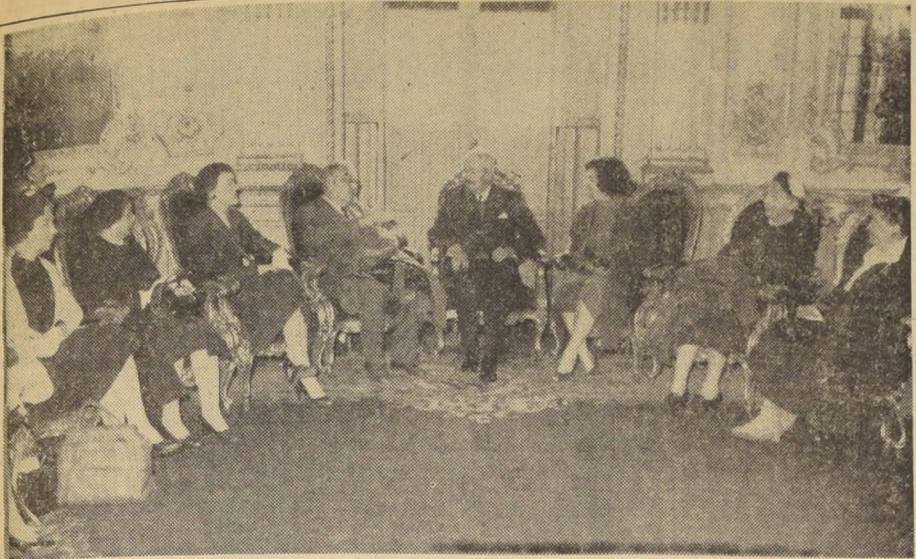
PROFESORES DE EE. UU.— Un grupo de diecinueve profesores norteamericanos, que se encuentra en Chile, visitó ayer al Jefe del Estado, Excmo. señor Ibáñez. Los profesores norteamericanos departieron con el Presidente de la República, breve y cordialmente.