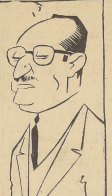
Ministro de Defensa del Ecuador, señor ALFONSO CALDERÓN, que está de visita en nuestro país.

Así, Leung Fah, como persona ofuscada, torció por el Callejón del Caballo Celestial, y avanzó arrastrando los pies, mientras sus ojos sin expresión parecían incrustados en un rostro de madera.