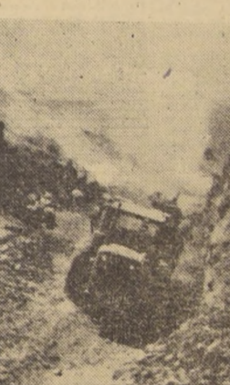
El S. M. P. construye actualmente el tramo Los Maquis-Pucallán del camino Nogales a Pichuncavil, lo que permitirá eliminar la cuesta actual y acortar la distancia hacia los balnearios de Quintero, Matucillo y otros de gran movimiento turístico. El tramo tiene aproximadamente 5 kilómetros y se caracteriza por la calidad del terreno del tipo llamado de dureza media y rocoso, lo que exige un empleo continuado de explosivos, como asimismo por los numerosos cortes que pasan los 12 metros de altura y terraplenes de 10 y más metros de largo aproximadamente. Al finalizar el periodo de trabajo que serán 35 kilómetros, esperándose tener terminada el año, La Unidad de Trabajo que tiene a su cargo estas obras pertenece al Regimiento Ingenieros N.º 2 "Aconcagua", de guarnición en Quillota y está constituida por 17 suboficiales y 30 conscriptos al mando de dos oficiales.