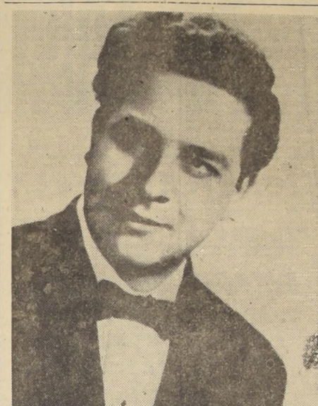
CANTARA "RIGOLETTO" - El notable barítono chileno Hernán Pelayo...