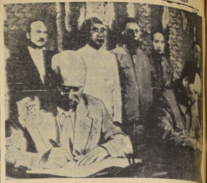
PEKIN.— El Primer Ministro de la Unión Soviética, Nikita Khrushchev (izquierda) y el Primer Ministro chino, Mao Tse-tung, cuando firmaban el comunicado conjunto el 3 de agosto, después de tres días de conferencias.

El puente aéreo fue interrumpido súbitamente anoche. Autoridades británicas y norteamericanas dijeron que no había indicios de cuándo se reanudaría. Este servicio estaba abasteciendo a la fuerza de paracadistas británica y estadounidense por Jordania después de desembarcar en Líbano fuerzas armadas norteamericanas.