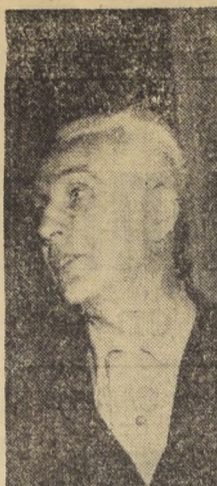
CLOTARIO BLEST, presidente de la Central Única de Trabajadores...