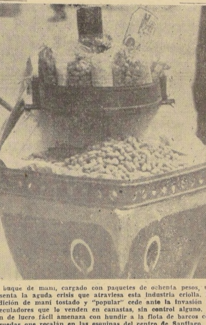
Un buque de mani, cargado con paquetes de ochenta pesos, representa la aguda crisis que atraviesa esta industria criolla. La tradición de mani tostado y "popular" cede ante la invasión de especuladores que lo venden en canastas, sin control alguno. El afán de lucro fácil amenaza con hundir a la flota de barcos con ruedas que recalán en las esquinas del centro de Santiago.