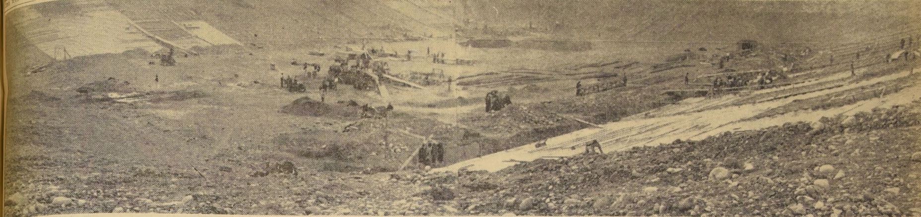
REALIDAD A CORTO PLAZO.— Eso es el estadio que está...