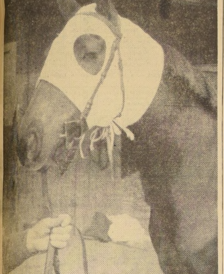
FINE A L'EAU, una de las cuatro favoritas en la "Polla de Potrancas". Repareció hace algunos días y en avance de última hora...