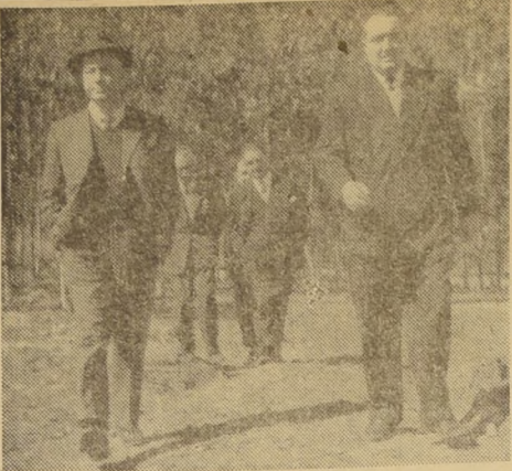
El Ministro de Obras Públicas, señor Yáñez Zavala, acompañado del

La variante que se ha construido parte de la misma estación de Copiapó y continúa al norte, cerca