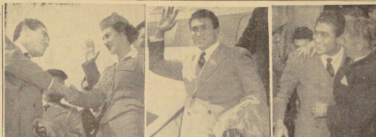
LEGA EL CAMPEON.— Andrés Selva, campeón argentino y sudamericano...