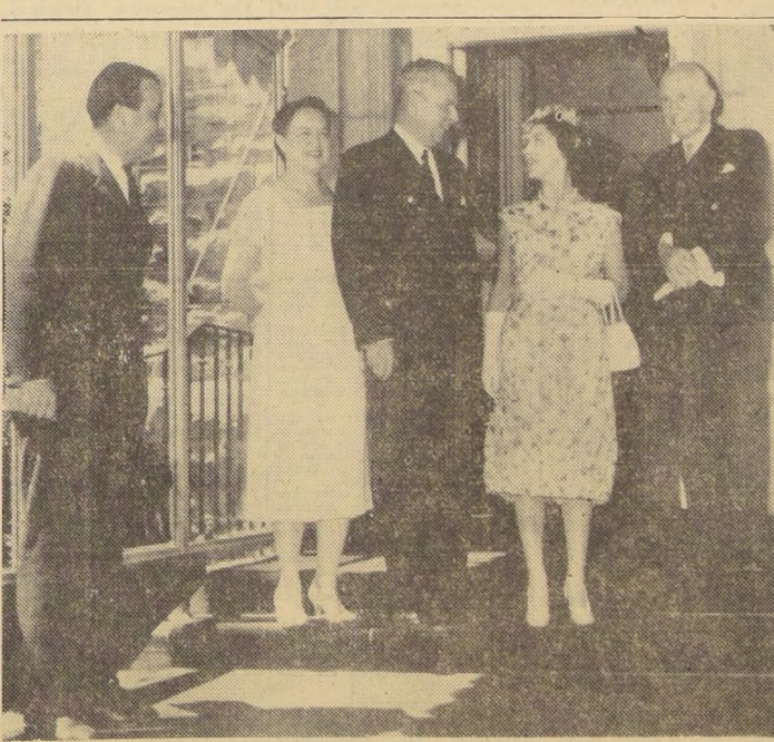
LA PRINCESA MARGARITA EN EL CANADA.— La Princesa Margarita recibe una calurosa acogida de parte del Primer Ministro del Canadá, John Diefenbaker y señora, a poco de llegar a Ottawa, por vía aérea, de regreso de su gira por el interior del Canadá. A la derecha de la Princesa aparece Vincent Massey, Gobernador General del Canadá. La Princesa Margarita visitó el país con ocasión del centenario del Gobierno de la Columbia Británica.

La Cámara conocerá hoy las modificaciones