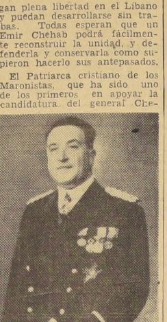
El general Fuad Chehab, nuevo Presidente de la República del Líbano.

En el año 1847, el Líbano, completamente liberado, hizo traer sus cenizas de Constantinopla, y le construyó una tumba en el Jardín Umbroso que el propio Emir había hecho plantar alrededor de su palacio de Beit ed Din.