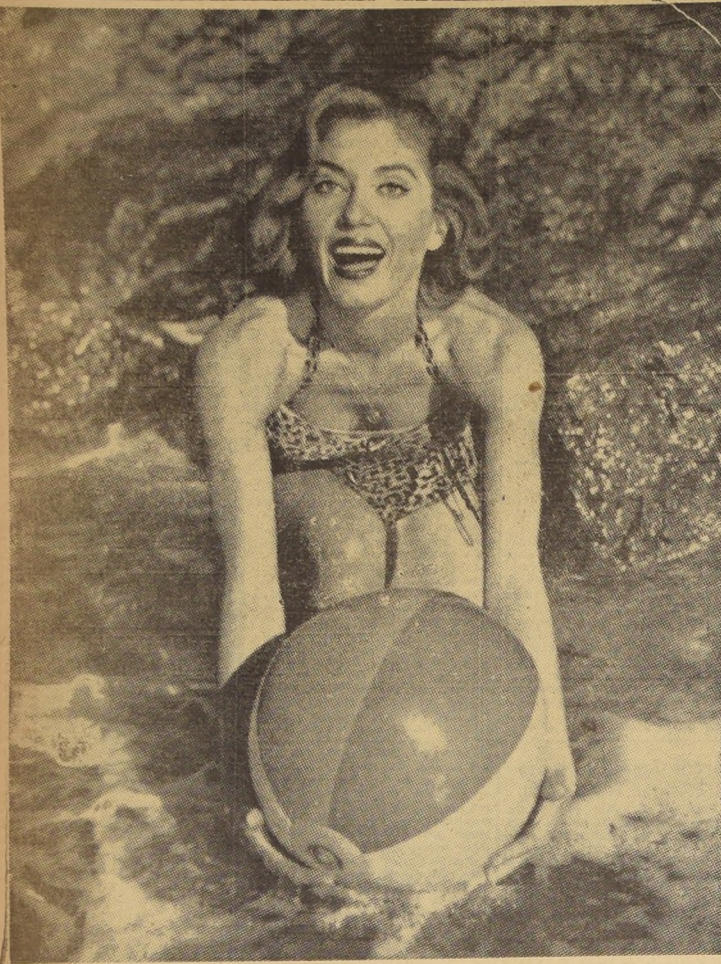
Brighton es uno de los más atractivos balnearios ingleses, y su fama se ve realzada por las lindas muchachas que lo frecuentan. La damita que aquí vemos, con su hermosa cabellera, su cutis terso y fresco gracias a la caricia de las brisas marinas, y sus ojos azul-marines, con justicia, muy admirada en las playas de Brighton.

El Principe Fuad Abdallah Chehab, auténtico descendiente de los emires "bechires". Personalidad del nuevo Mandatario.