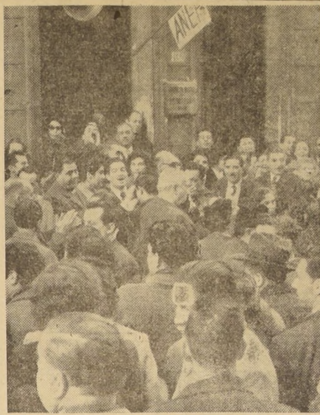
Los Empleados Fiscales, cumplieron ayer la huelga de 24 horas que ordenaron en apoyo de sus peticiones de reajuste económico.