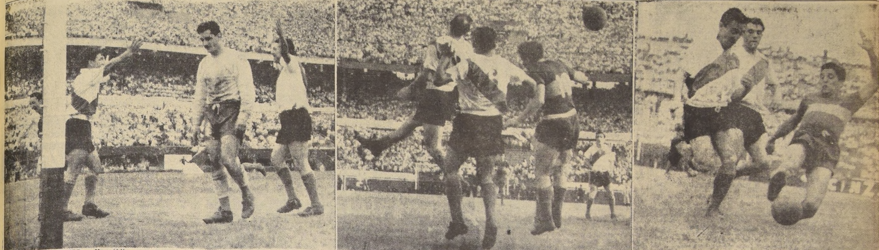
MERECIO GANAR RIVER.— Un público que desbordó el Estadio de Núñez, presenció el domingo último el "clásico" del fútbol argentino: River Plate-Boca Juniors. El match resultó un empate a 2 goles, pero de acciones vibrantes, intensas. El calor sofocante y la humedad no influyeron para nada en la agresividad, en el ardor con que se llevaron las alternativas. El

de algunos jugadores que serían seleccionados para el equipo nacional, Atlético de Bilbao ha decidido no efectuar el viaje. Larrain añadió también que en vista de ello la Federación Española de Fútbol estudia la posibilidad de designar un combinado que represente al fútbol hispano en Santiago de Chile.