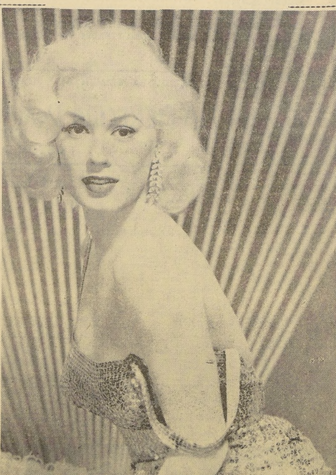
PERO CON ESTE VESTIDO.— Esta hermosa que muestra hombro y espaldas que hacen temblar las piernas, es Mamie Van Doren, tal como aparece en una de sus últimas películas: "Escuela del vicio". Desde luego, ella hace el papel de maestra, y da la impresión de que debe de ser una buena maestra. Pero, el nombre del colegio, ¿no es un poquitín raro?