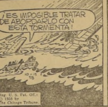
Dick Tracy comic strip caption