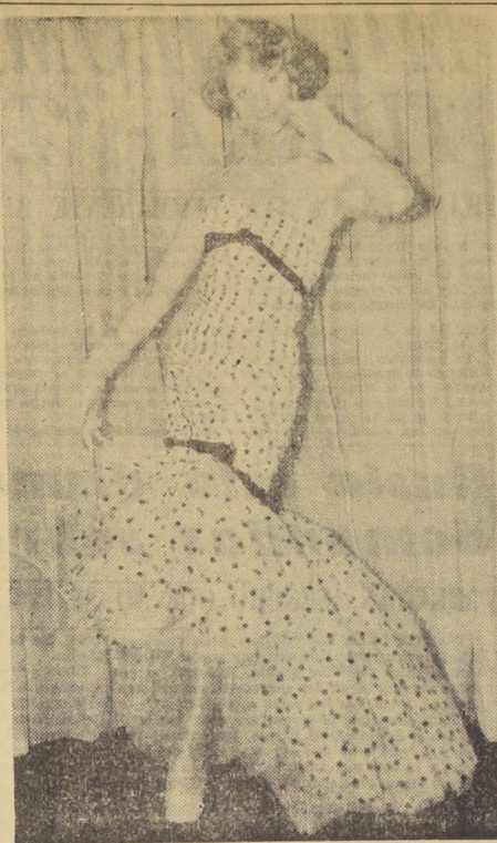
"LA FIESTA", es un modelo creado para las fiestas de noche por Bernard SACARDOY, París. Está hecho de un tul nylon blanco con pintitas negras y adornado con cintas negras de grograin.

MUEBLES DE GRAN OCASION 1028 - Nataniel - 1028 $ 38.000.— precioso living estilo normando, tapizado en fino brocado de seda, otro, chipendale $ 50.000.— fantástico amoblado living abanico, fina terminación, única oportunidad $ 75.000.— maravilloso living super-abanico, con doble colchón en plumas, marabú y flecos. Aproveche esta ocasión $ 70.000.— amoblado comedor completo 8 piezas, estilo normando, hecho en lingües, barniz patinado $ 125.000.— gran ocasión, lindísimo dormitorio estilo normando completo con ropero de tres cuerpos desarmable y espejos importados $ 45.000.— regalo amoblado comedor moderno completo, 8 piezas. Hay, además, infinidad de muebles en diferentes estilos, a precios botados. Antes de efectuar su compra, por su conveniencia visite nuestra casa principal en 1028 - Nataniel - 1028 Para comerciantes, precios especiales. Enviamos a provincias.