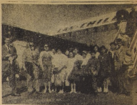
FELIZ ARRIBO A SANTIAGO.— Como en años anteriores la Cia. de Cervecerías Unidas ha establecido como premio a los escolares de todo el país un viaje a la capital en que participan niños provenientes de los puntos más alejados de territorio nacional. En el grabado se ve una delegación de Punta Arenas a su llegada a Los Cerrillos, quienes forman parte de la Caravana Bilz