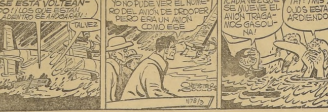
Por Chester Gould comic strip caption