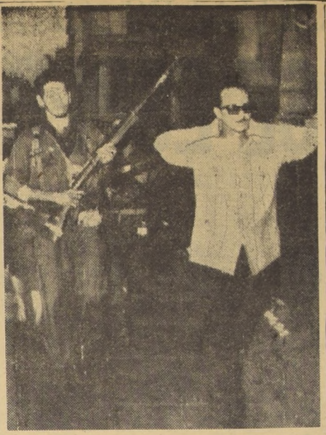
LA HABANA.— Una persona que se consideró sospechosa, es arrestada y llevada bajo vigilancia fuera del palacio presidencial poco después de la llegada del Presidente Provisional, Manuel Urrutia.—.