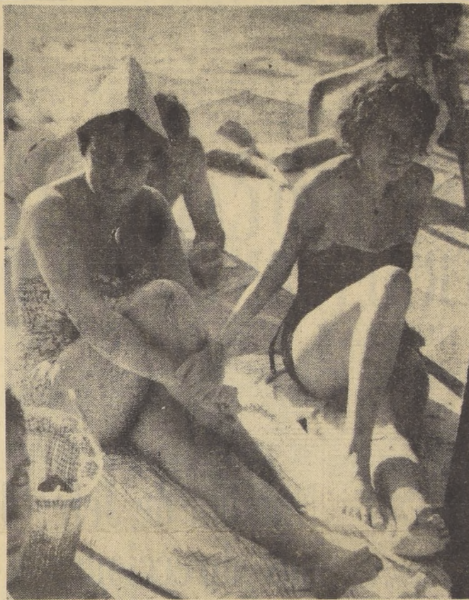
Descendió ayer la temperatura en Santiago, pero no mermó la concurrencia a las piscinas, y el grabado es una buena muestra de ello. La onda de calor que en las primeras horas de la tarde calcina las calles de la ciudad, fue menor ayer, después del record del miércoles: 32,3 a la sombra y sobre los cincuenta a pleno sol. Para los habituales asistentes a las piscinas de Santiago, el aumento de la temperatura ofrece mayores perspectivas de gozar de buena compañía. Si no, que lo diga el caballero que "se tuesta" y observa lo que mereció el flash del fotógrafo de LA NACION.