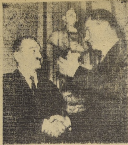
WASHINGTON. El Vicepresidente Richard Nixon (derecha), suada al Vicepremier de la Unión Soviética, Anastas Mikoyan, en sus momentos en que este último visita a Nixon, en el Capitolio, el 6 de enero. Nixon dio a Mikoyan un saludo por el Primer Ministro Nikita Khrushchev.

BUENOS AIRES, 8 (UPI).— El senador chileno Luis Bossay, candidato presidencial del Partido Radical, que recibió hoy en audiencia especial por el Presidente Arturo Frondizi.