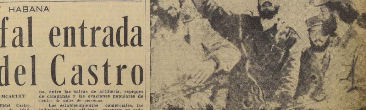
LA HABANA.— El héroe revolucionario cubano Fidel Castro aparece rodeado de sus entusiasta partidarios al entrar a La Habana, ayer a las 14.55 horas, encabezando una columna blindada. Castro que el 2 de diciembre de 1956 desembarcó con 80 hombres en las costas cubanas, logró derrotar a Fulgencio Batista en una de las más extraordinarias guerras de guerrillas que se

hayan librado. El héroe recibió una triunfal bienvenida, y luego de llegar al Palacio Presidencial y abrazar al Presidente Provisional, Dr. Manuel Urrutia, habló a la multitud. El líder entró a La Habana en un jeep portando en su mano derecha un fusil-ametralladora portátil.