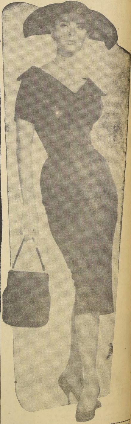
DE SEDA NEGRA.— Sofia Loren luce un traje de jersey de seda negra con amplios nudos colgantes como adorno y mangas cortas. El vestido ha sido ajustado para moldear las armoniosas curvas de la actriz. Actualmente Sofia filma con Gary Grant y con Anthony Quinn.