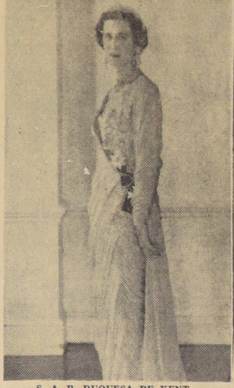
S. A. R. DUQUESA DE KENT

CABO CASAVERAL, 3.—(UPI).— Estados Unidos lanzó hoy un satélite con el objeto de pasar la Luna, y ponerlo en órbita alrededor del sol, y los cuatro motores del cohete entraron en funcionamiento con todo éxito. El cohete, un Juno II del Ejército, con un peso total de 60 toneladas y un cono cargado de instrumentos que pesaba alrededor de seis kilos, se elevó majestuosamente de Cabo Cañaveral a las 0,11 y se perdió en la clara noche. Catorce minutos más tarde, la Dirección Nacional de Astronáutica y Espacio, anunció que tanto el lanzamiento como el encendido sucesivo de los motores habían sido afortunados.