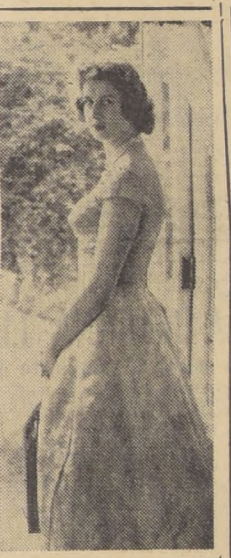
LA PRINCESA Alejandra, gentil acompañante de su madre, en la jira de acercamiento que la misión de la familia real británica realiza por los países latinoamericanos. Durante varios días será objeto de la atención pública chilena.

La Duquesa de Kent, de la real familia británica, considerada como una de las damas más distinguidas y elegantes de Europa, llegará esta tarde a Santiago, en una visita de ocho días. Viene acompañada de su hija, la Princesa Alejandra, atractiva heredera, y de cinco personalidades de la Corte de Su Majestad Británica. La jira latinoamericana de la Duquesa abarca cuatro países —México, Perú, Chile y Brasil—, y representa los anhelos del Reino Unido, de elevar las relaciones con estos pueblos al mismo nivel que alcanzaron hasta 1949. Su viaje, anunciado en septiembre del año pasado, provocó nutridos comentarios en la Commonwealth y expectativa en los países incluidos en su agenda. En Chile, donde existen especiales lazos de amistad hacia Gran Bretaña, la visita de la Duquesa de Kent y de la Princesa Alejandra ha sido considerada con especial afecto y, esta tarde, al pisar tierra chilena, serán declaradas "Huespedes Ilustres de Santiago", recibiendo de inmediato las instancias municipales que acreditan esta distinción.