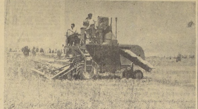
Las máquinas cosechadoras permiten una faena más rápida, con lo que los productos pueden llegar más oportunamente a los mercados de consumo. A medida que aumenta la mecanización de las faenas agropecuarias surge un número suficiente de mecánicos y expertos que manejan, mantienen y reparan la maquinaria, con lo que se facilita cada vez más su utilización. (En el grabado se pueden observar dos aspectos de estas modernas maquinarias.)