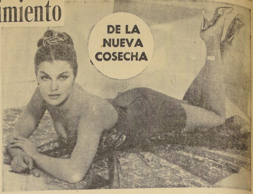
DE LA NUEVA COSECHA

Es muy diferente, en cambio, la perspectiva que se le ofrece a los jóvenes. Los deportes son estimulados en gimnasios, piscinas y clubes. La Casa de la Cultura y en los mismos establecimientos fabriles hay grupos filodramáticos, cines, conferencias políticas y técnicas, muestras, de arte soviético y cursos de estudio de coreografía, música y pintura.