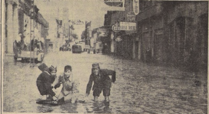
Una vista de la calle Colón, centro comercial de Los Angeles, cuando el agua comenzó a bajar, el sábado.