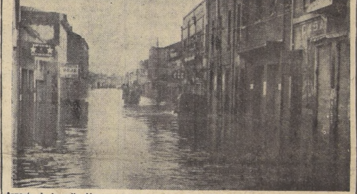
Aspecto de la calle Almagro, totalmente inundada. En esta calle el comercio sufrió graves pérdidas.