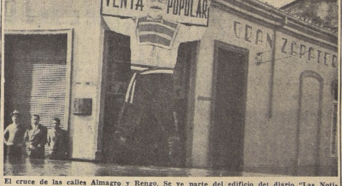
El cruce de las calles Almagro y Rengo. Se ve parte del edificio del diario "Las Noticias", que fue anegado.