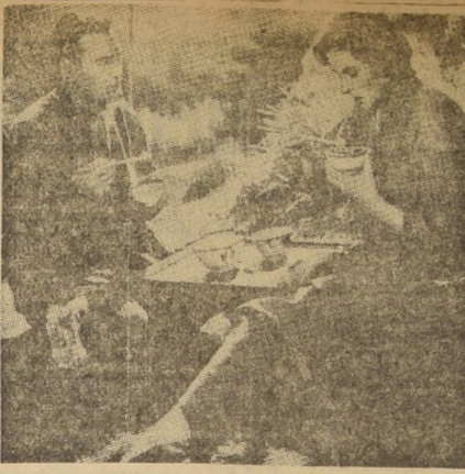
BRILLANTE ACTUACION.- El grabado muestra a la actriz sueca Ingrid Bergman junto al actor Curt Jurgens, en una escena de la película "La Posada de la Sexta Felicidad", que se estrena hoy simultáneamente en los cines Windsor y Astor.