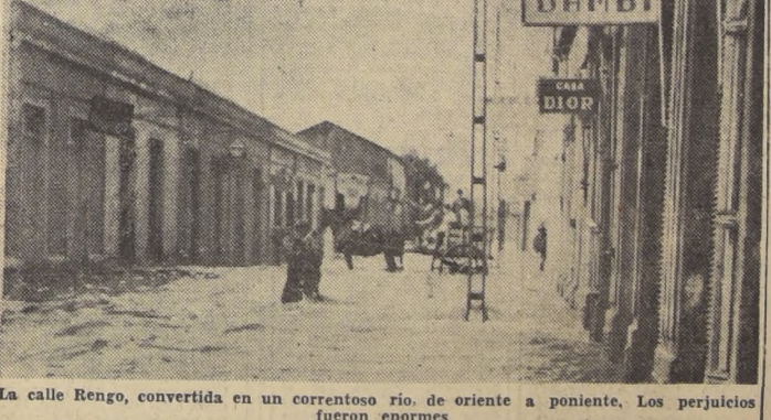
La calle Rengo, convertida en un correntoso río, de oriente a poniente. Los perjuicios fueron enormes