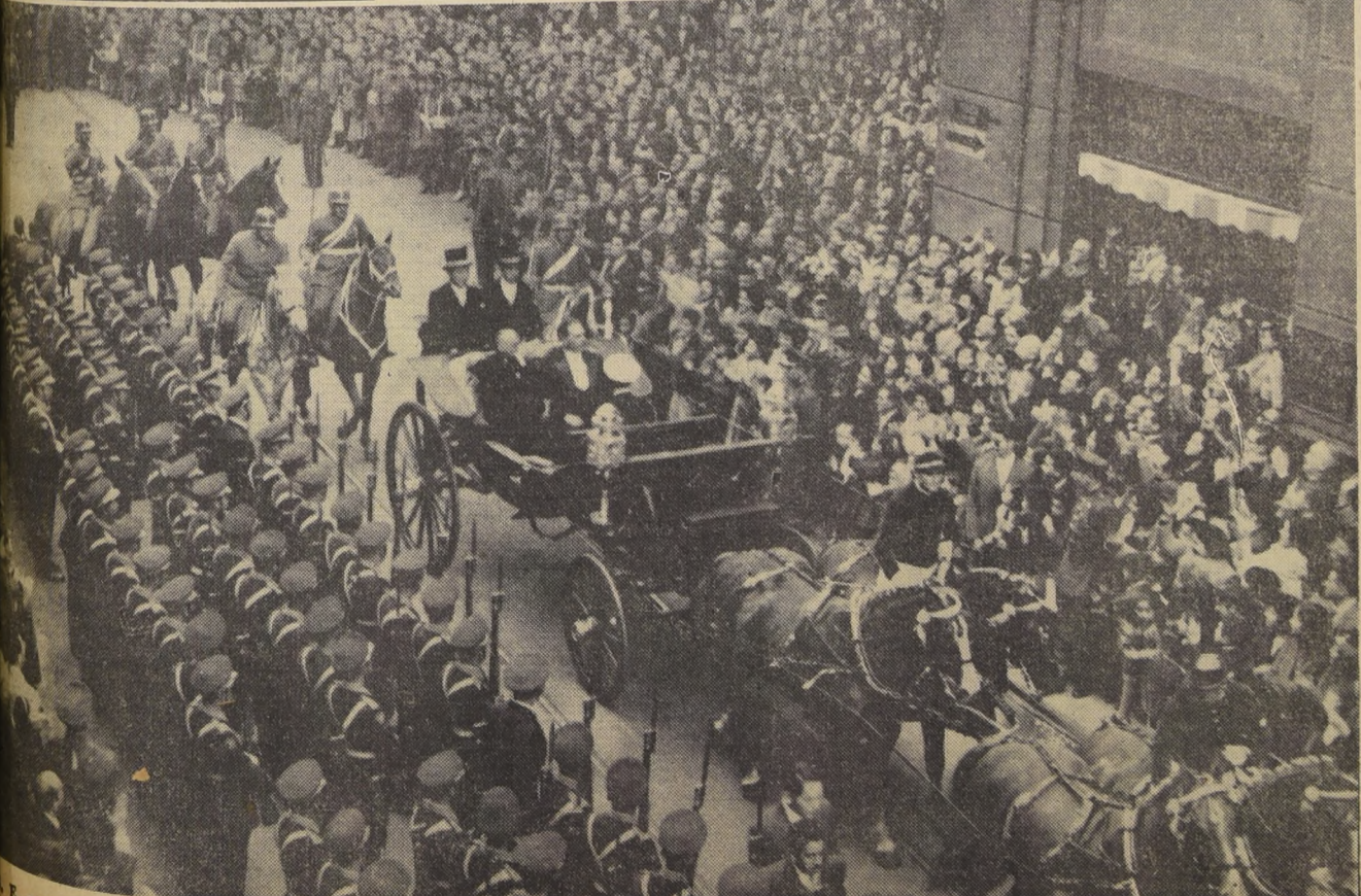
En su carroza y las FF. AA. le rinden honores, mientras el público le tributa su simpatía

Desde mucho antes de la hora fijada para la iniciación de la ceremonia en el Congreso, el público ya había comenzado a estacionarse frente a la Moneda y por las calles fijadas para el recorrido. Ese mismo público permaneció en sus puestos, durante todo el tiempo que el Presidente empleó en leer su primer Mensaje al Congreso.