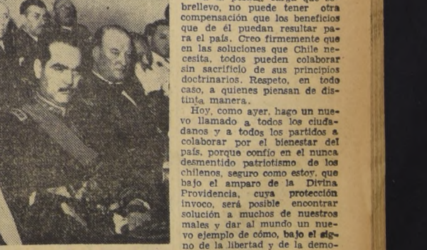
EL CONTRALOR GENERAL y los Comandantes en Jefe de las tres ramas de las FF. AA. y el General Director de Carabineros escucha el Mensaje del Presidente.

El problema de la vivienda es uno de los más importantes que se plantea al Gobierno. El problema de la vivienda es uno de los más importantes que se plantea al Gobierno.