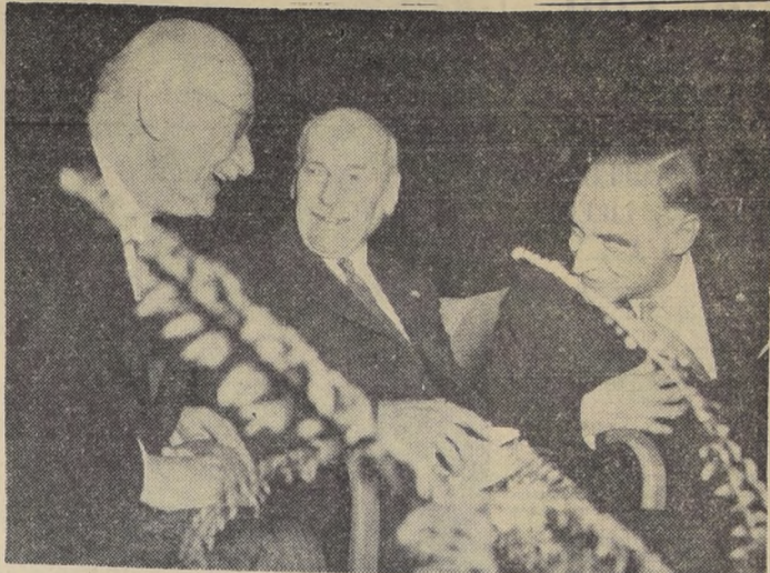
BERLIN OCCIDENTAL.— Foto tomada el 12 de mayo, en una reunión en masa en el Estadio cerrado Deutschlandhalle. Aparecen en animada conversación, de izquierda a derecha: el ex Primer ministro francés, Robert Schuman; ex Primer Ministro británico, conde Attlee, y ex gobernador militar norteamericano para Alemania, general Lucius D. Clay. Fueron invitados de honor de la ciudad para la celebración del décimo aniversario del levantamiento del bloque soviético de Berlín, en 1949. A la reunión en masa asistieron alrededor de 12.000 berlinenses occidentales.

Aspectos: Descripción política, económica, turística y lugares santos. LA ENTRADA ES LIBRE