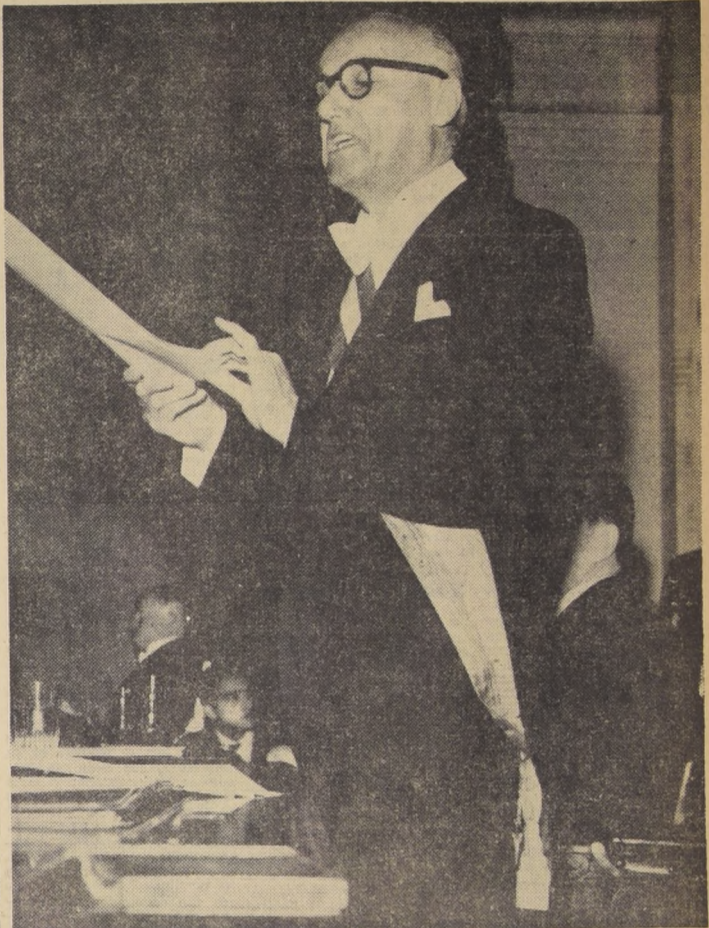
El Excmo. Sr. Alessandri lee su Mensaje ante el Congreso