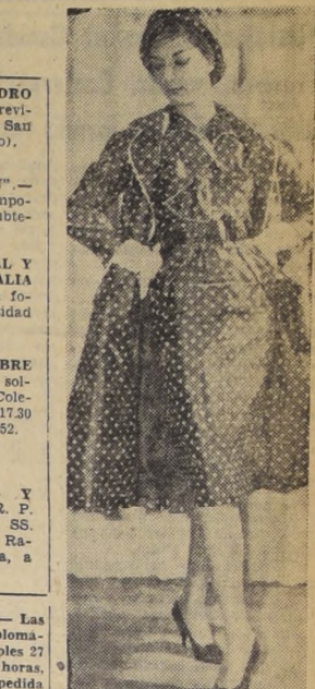
DE LONDRES y exhibido en la colección de Rahib. Vestido de foulard de lunares blancos, en fondo azul marino. El tapado es del mismo género. Se completó con un pequeño sombrero, que deja al descubierto la cara.— (Foto UPI)

EXPOSICION DE PEDRO MARTINEZ. — Sala de Previsión del Banco de Chile, San Antonio 327 (subterráneo). SALA "LE CAVEAU" — Pintura francesa contemporánea. Estado No 36 (subterráneo). REALIDAD CULTURAL Y ARTISTICA EN LA ITALIA MODERNA. — Exposición fotográfica en la Universidad de Chile. UN CINE-FORO SOBRE la película "Despedida de soltero", en el Teatro del Colegio de San Ignacio, a las 17.30 horas. Alonso Ovalle 1452. MAÑANA: TEMA: "NOSOTROS Y DIOS" — A cargo del R. P. Florencio Infante Díaz, SS. CC. en la Radio CB-76, Radio Cooperativa Vitónica, a las 8 y 21.15 horas.