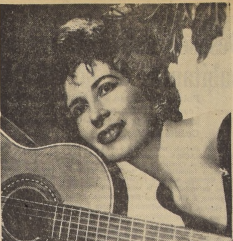
CANTANTE CHILENA REGRESO AL PAIS. — Trás una larga temporada en Lima, adonde fuera contratada especialmente para inaugurar la flamante estación televisora del Perú...