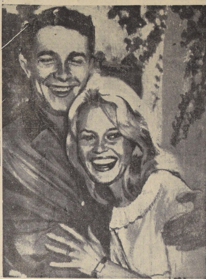
LOUVECIENNES (Francia). — La Bomba del cine francés, Brigitte Bardot, sonríe feliz en los brazos de su segundo marido, el actor Jacques Charrier, con quien contrajo matrimonio ayer en este pueblo, aunque se había anunciado su matrimonio con anterioridad. Fue una fiesta de la reina del glamour galo, para despistar a los periodistas y poder pasar en paz las primeras horas de su matrimonio.— (Inf., última página, Sección GENTES)