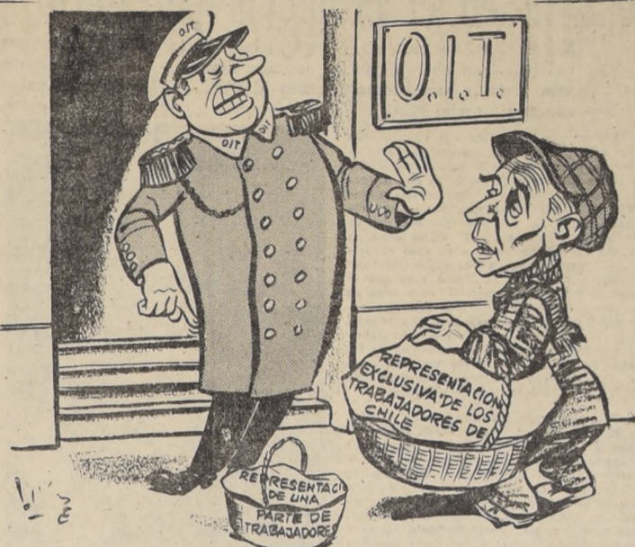
DON CLOTA: ¿Se puede pasar, compañero? LA OIT: Cuando quiera, camarada; pero no con ese canastazo, sino con aquel que dejó en el suelo...