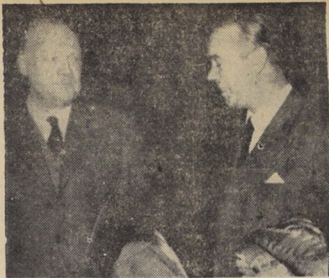
A BUENOS AIRES — Luego de una visita de negocios...