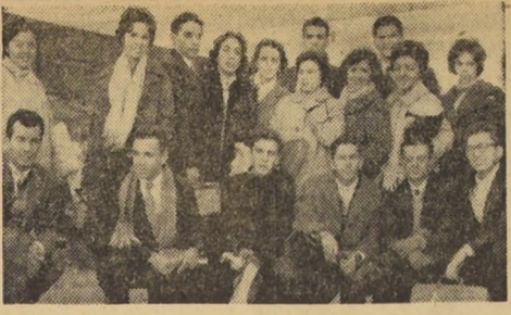
CORO MADRIGAL RENACENTISTA. Los veintiseis integrantes del famoso "Coro Madrigal Renacentista", de Bello Horizonte, Brasil, llegaron ayer a Santiago en el Cometa IV de Aerolíneas Argentinas...