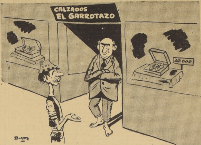
-Oiga, íñor, yo compraría aquí mis zapatos si usted no se hubiera sacado los suyos con los precios...