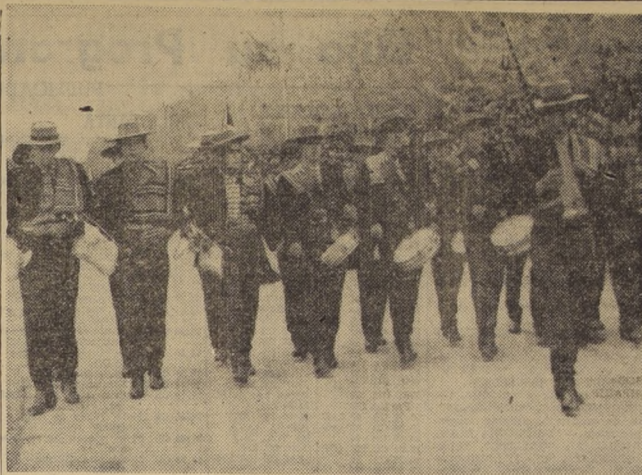
RANCAGUA. - Alumnos de la Escuela Agrícola de Quimávida, desfilan ante las autoridades, durante la ceremonia cívico-militar...