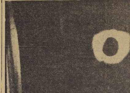
BOSTON. — Esta foto muestra el eclipse total de sol de 55 segundos de duración tomada el 2 de octubre desde el aire a una altura de 21.000 pies. Las nubes se pueden apreciar abajo (derecha).

La salida del embajador Sinehedin el Tarazi, hacia Pekín, quedó aplazado mientras el gobierno de Nasser aguarda la respuesta de una nota de protesta enviada a Pekín por el discurso de Baghdadsh.