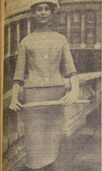
Creación de JEAN PATOU, en cuadros beige y blanco, con mangas tres cuartos y un movimiento muy nuevo de los hombros.