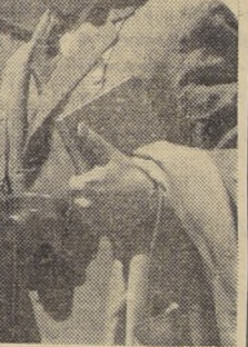
Partieron delegados de Chile a sesiones de FAO. El Vicepresidente de la Sociedad Nacional de Agricultores...