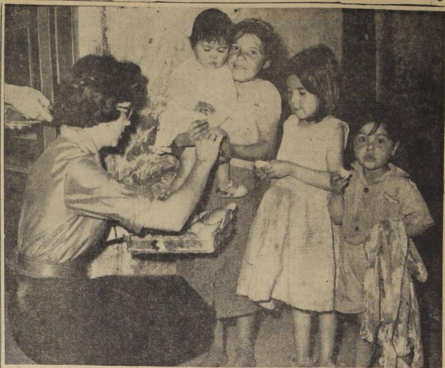
AYUDA, ESTUDIO Y SUPERACION.— Alrededor de cincuenta ex alumnos del Colegio San Ignacio...