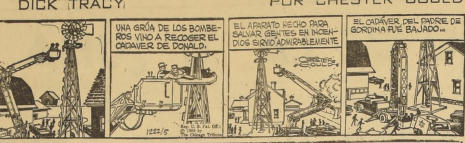
UNA GRúa DE LOS BOMBERSOS VIÓ A RECUPERAR EL CADÁVER DEL PADRE DE DONALD... EL APARATO HECHO PARA SALVAR GENES EN INCENDIOS SIRIÓ ADIVINABLEMENTE...