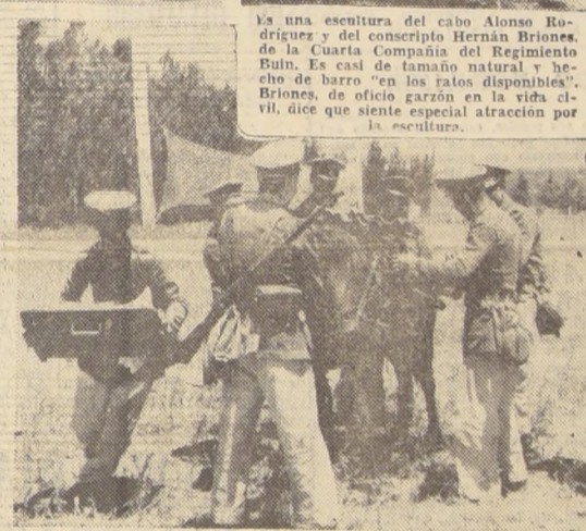
A la orden de "desabracar", hay que desmontar el equipo para, enseguida dar paso al descanso, luego de una jornada de seis horas en el terreno. Esta sección es del "Yungay", de San Felipe.