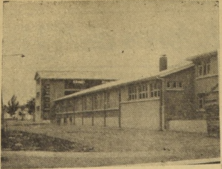
SAN MIGUEL.— Aspecto parcial del edificio construido por la Sociedad Constructora de Establecimientos Educativos...