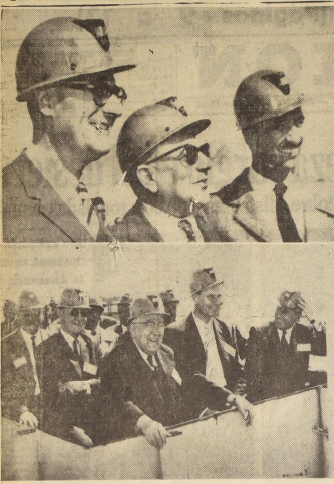
CON CASCOS MINEROS.— Bajo el arriente sol del desierto de Atacama, que encierra tantas páginas de la historia patria, los asistentes a la inauguración del nuevo mineral "El Salvador", usaron el casco minero con toda la naturalidad que permitía la tórrida temperatura, para poder bajar a la mina. Arriba, el Ministro de Finanzas, Roberto Vergara Herrera, pronunció un discurso, destacando las necesidades de incrementar los aportes de capitales extranjeros, que, coordinados con los esfuerzos nacionales, podrán sacar al país de su etapa de subdesarrollo.