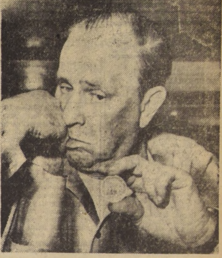
COMICO CON PROBLEMAS. Bud Abbott (del lado izquierdo) con el Tio Sam. Aunque en el grabado muestra una medalla que el Departamento del Tesoro le otorgó en 1941 por servicios patrióticos...