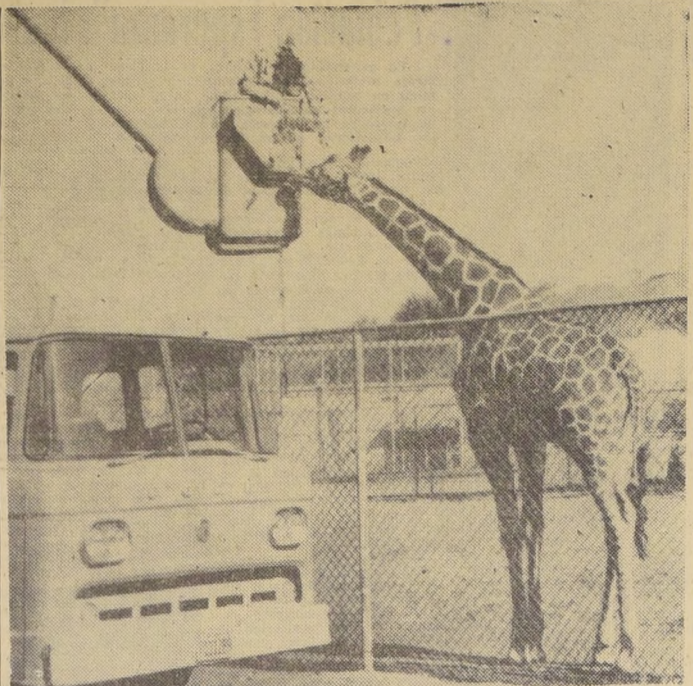
"EXAMEN MEDICO"— SAN FRANCISCO la frente a la jirafa regalona del Zoo. Para el examen se ha valido el aparato que se usa para podar los arboles...