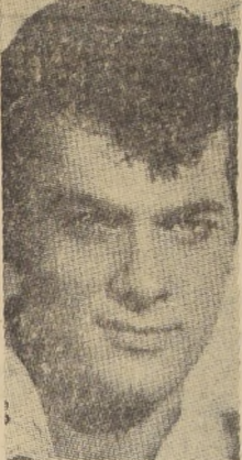
TONY CURTIS "Por la Flauta" podrá decir Tony Curtis