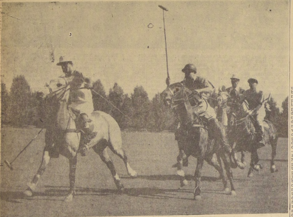
EN LAS CANCHAS del Club de Polo San Cristóbal comenzaron el jueves 24 dos torneos de este deporte: la disputa de la Copa San Pedro, para equipos de hasta 7 goles...