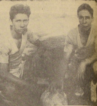
LES SOBRA ENTUSIASMO, pero les falta mayor ayuda a los deportistas de las industrias. El esfuerzo que hacen al practicar deporte luego de agotadoras jornadas de trabajo...