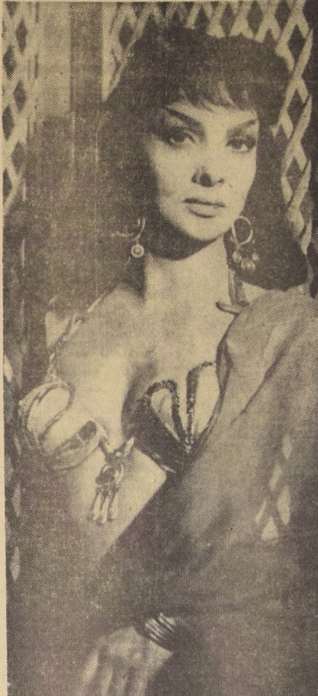
CARRERA CONTRA EL TIEMPO