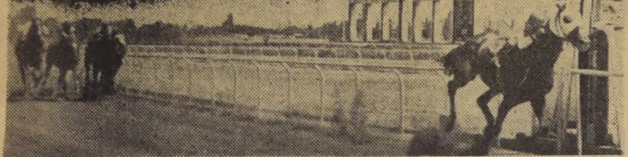
FACIL TRIUNFO. Con mucha comodidad ganó Coker el clásico "Dr. José María Lora", prueba central del programa matutino. El hijo de Cockney, por siete cuerpos,