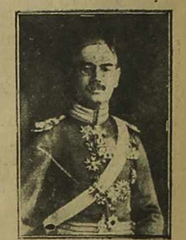
Excmo. señor von Eckert Enviado Extraordinario y Ministro Plenipotenciario del Imperio Alemán en Chile.

La particularidad más importante del U-C-5 estriba en que carece de tubo lanzatorpedos y sólo tiene seis tubos para minas que desembocan a entrambos lados del casco. Cada uno de estos tubos tiene capacidad para contener dos minas cargadas de 125 kilogramos de explosivos y que están provistas de dispositivos especiales para poder funcionar debidamente. Los tubos para minas atraviesan al buque de parte a parte, de modo que el agua de mar penetra hasta ellas fácilmente. Con relación al eje del buque, el de los tubos está colocado oblicuamente a fin de que las minas, que están sujetas por medio de un cerrojo que se maneja desde el kiosco, puedan ser lanzadas hacia atrás y no lleguen a tapar con el casco en el momento de ascender a la superficie. Cuando el U-C-5 fué capturado se le remolcó hacia la orilla, y fué varado en un cerrojo que se remolcó no puso obstáculo para remolcarlo.