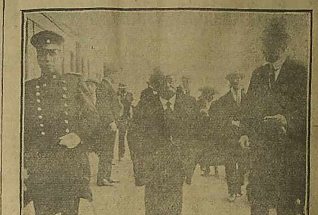
El Excmo. señor don Ricardo Bentin, vice-Presidente del Perú, a su llegada a Santiago a medio día de ayer.