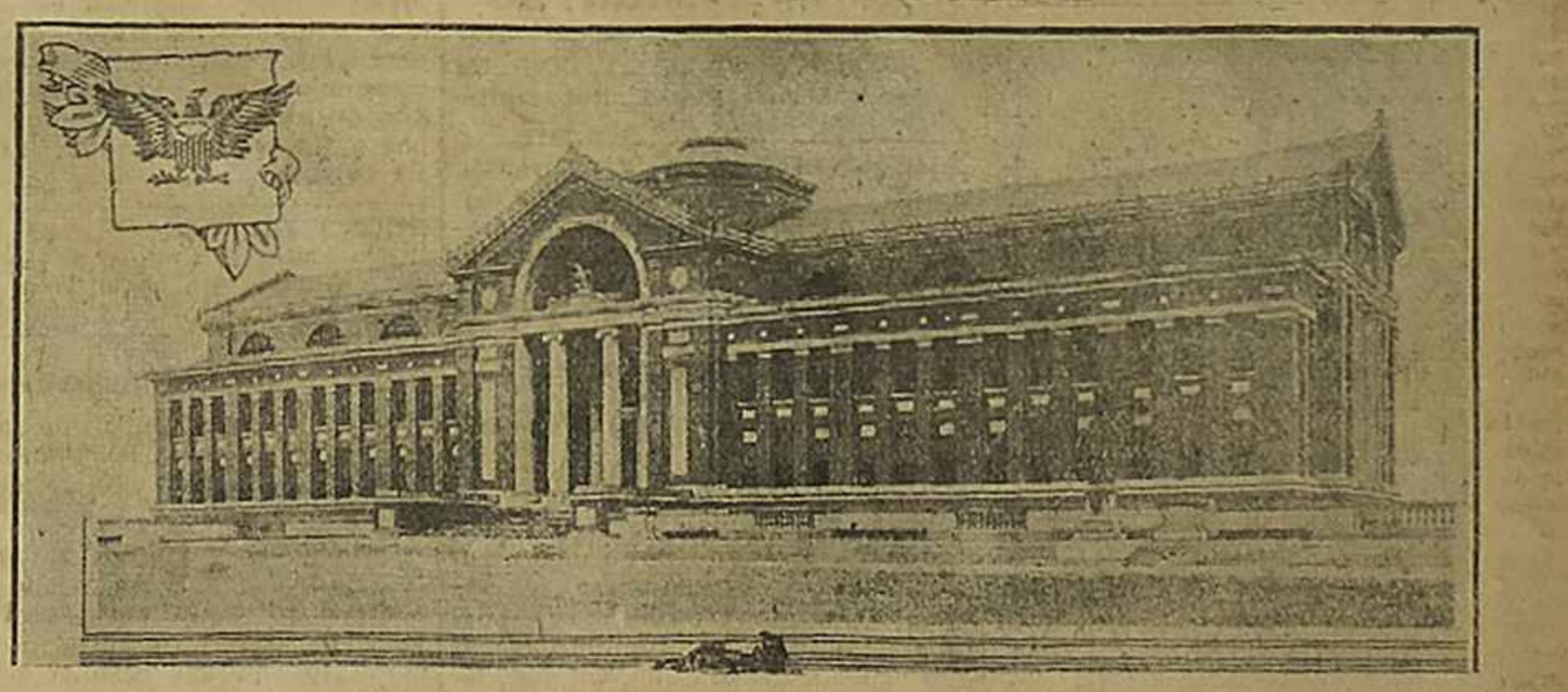
Vista de la fachada principal de la nueva Escuela Militar de Washington donde estudian la manera de resolver los problemas de estrategia los futuros oficiales del Ejército norteamericano. Actualmente está a cargo del coronel Kuhn que regresó ha a poco de Alemania adonde fué comisionado por su Gobierno.