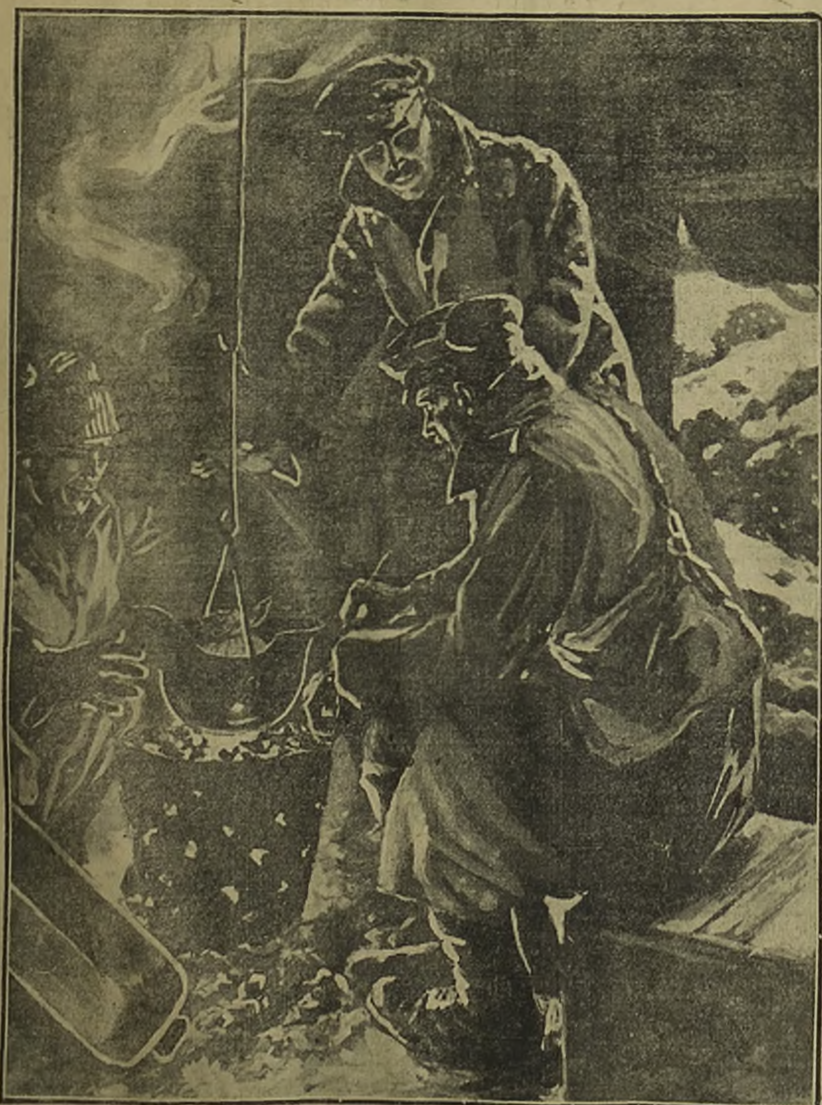
Haciendo un Pinn-Pudding en un casco de acero alemán.

Cuando se le anunció en cierta ocasión a Rachilde que en una revista pensaban dedicarle una crónica: "¡Cuidado!— exclamó.— Mis libros deben estar bajo llave", y sus ojos y sus labios roían alegremente.