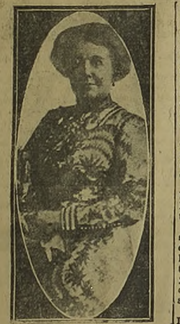
Lloyd George en el Parlamento