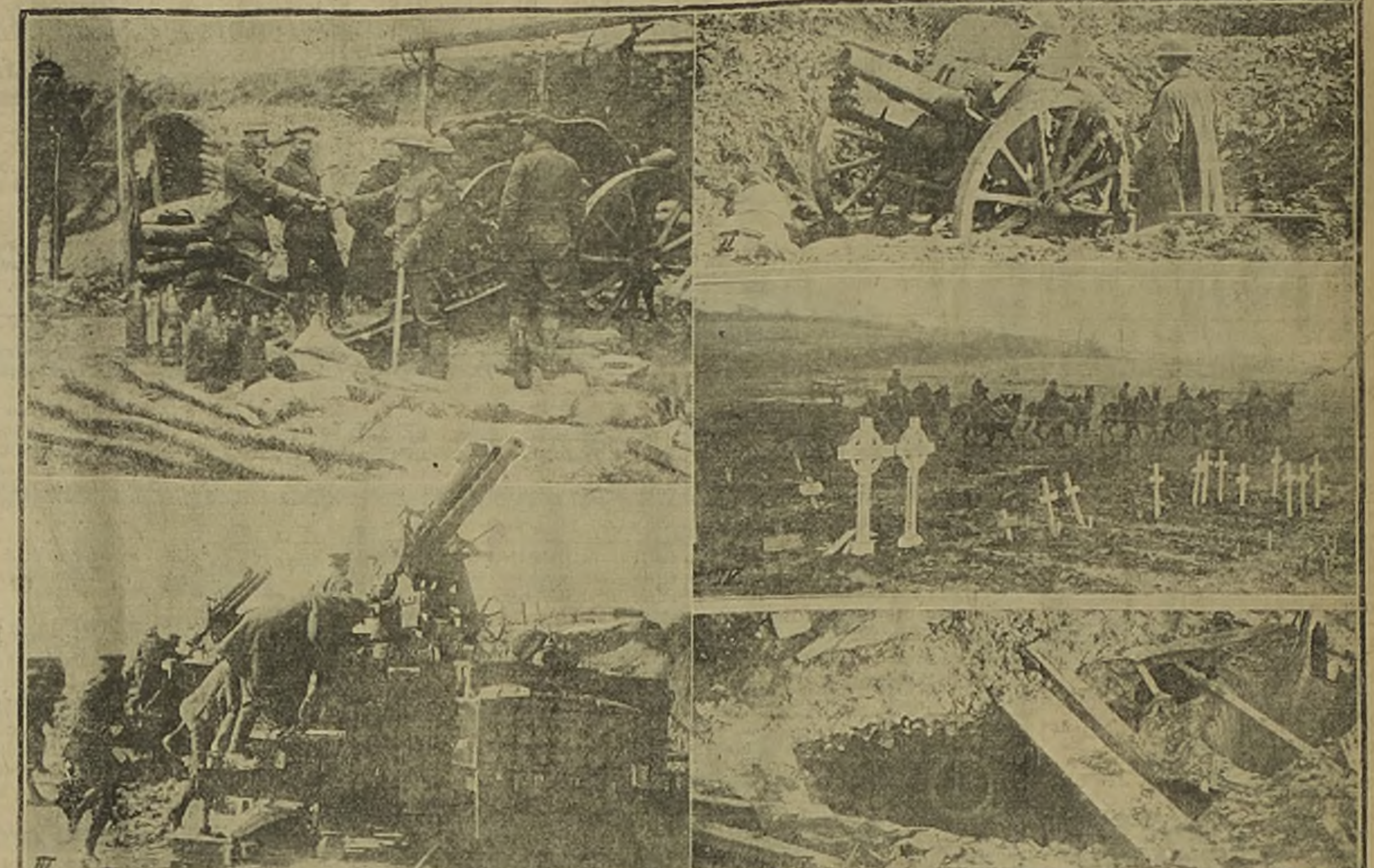
I. Las fábricas de carrillos hacen llegar sus productos a las baterías. En la fotografía se ve a un sargento recibiendo un paquete. II. Hojo producido por la explosión de una granada que se usa como emplazamiento de una posición avanzada. III. Cañones canadienses contra aviones enemigos, en acción. IV. Se emplean doce caballos enganchados para la conducción de municiones de gran calibre. V. Una posición alemana capturada por los ingleses. Puede observarse al cañón colocado en la boca del subterráneo.

vocarnos, que fué un gravísimo error el no haber dotado, antes de fundir una sola tonelada de lingote, el establecimiento de todos los elementos necesarios para producir aceros y ferros elaborados de venta inmediata.