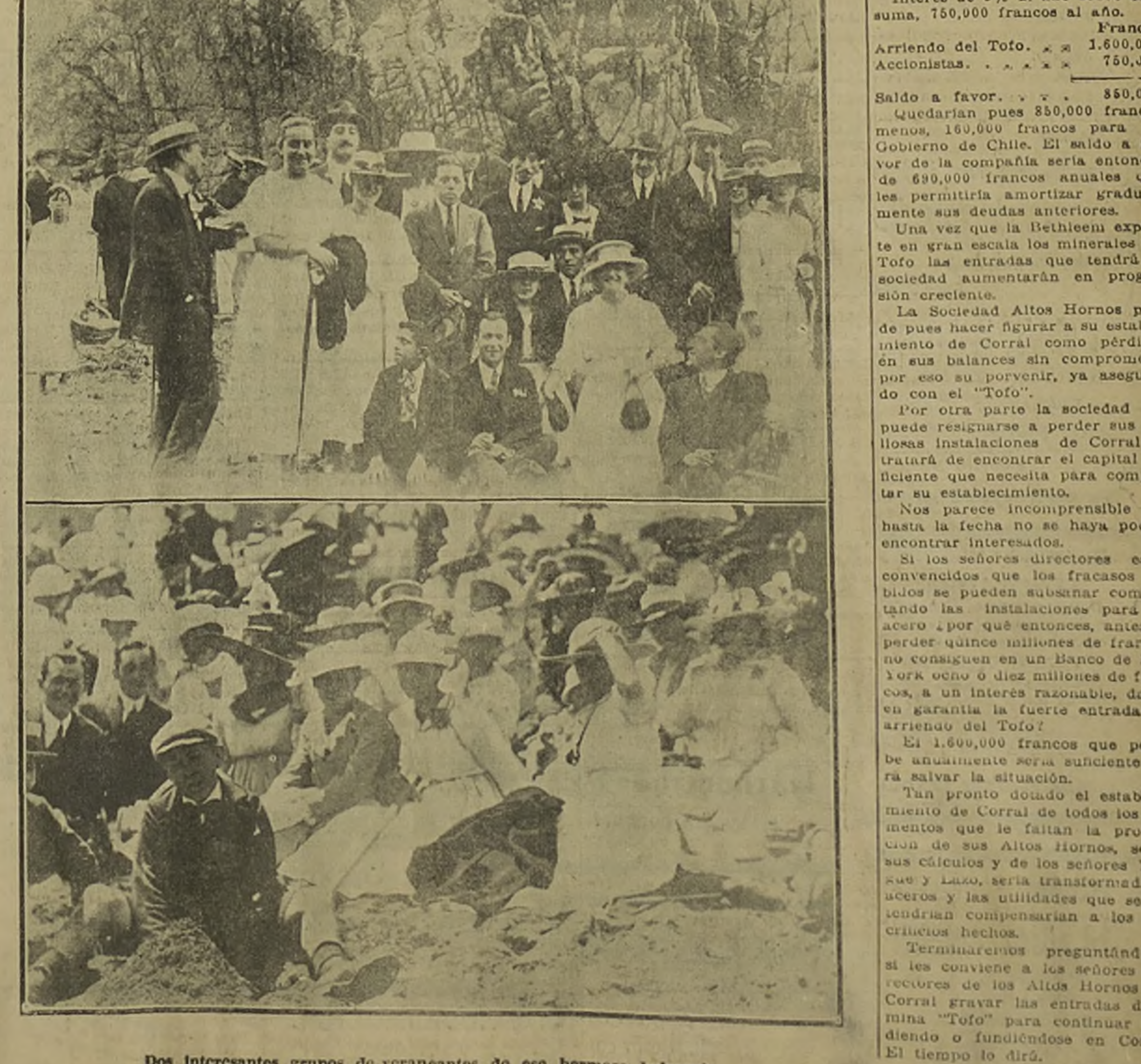
Dos interesantes grupos de veraneantes de ese hermoso balneario JUVENCIO.