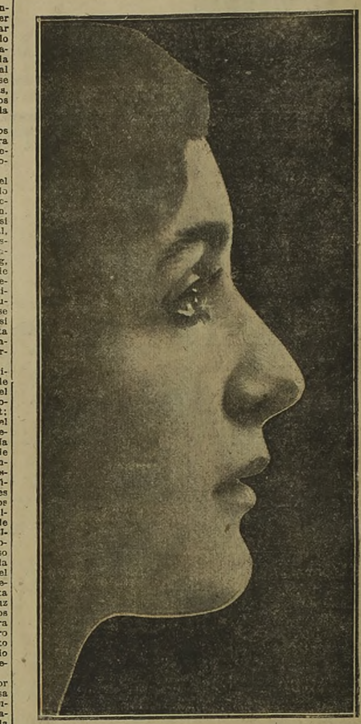
FRANCESCA BERTINI DANUBIO. Budapest, 1916.

El primero que se arrodilla ante el rey es el hermano del conde de Tisza. Inclina su cabeza, y el rey Carlos deja caer suavemente su espada sobre el hombro izquierdo del valiente oficial.