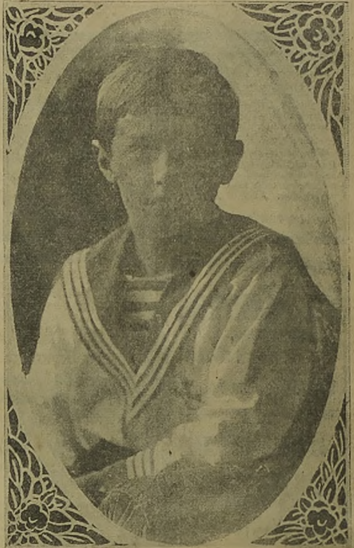
Ultimo retrato del príncipe Alexis, único hijo varón del Czar Nicolás II, que se encuentra enfermo gravemente, según un telegrama que publicamos ayer.

movimiento en este frente, aun cuando sólo sea con la esperanza de malograr lo que piensan, que es nuestro plan. Se ha informado que el Kaiser tenía la idea de forzar la paz después de una invasión aplastadora en Rusia, después de que cayese Verdun y una vez concluida la aventura de Rumania; pero como Rusia no ha sido aplastada y Verdun no ha capitulado, se pospuso la gestión hasta después de la toma de Bucarest. Actualmente, el odio alemán contra Francia e Inglaterra, a consecuencia de la respuesta dada a la iniciativa pacifista del Presidente Wilson, se ha desarrollado de tal suerte, que el sentimiento popular espera que los mariscales de campo von Hindenburg y von Mackenzer atacarán a los aliados en el oeste para obligarlos a escuchar la razón tal como ellos la entienden. De otra parte, se comunica que la situación de Alemania es peor de lo que se supone en el exterior; asegúrese que se han producido fricciones entre los jefes de los distintos Estados alemanes, y subditos de países neutrales manifiestan que los campesinos exteriorizan su