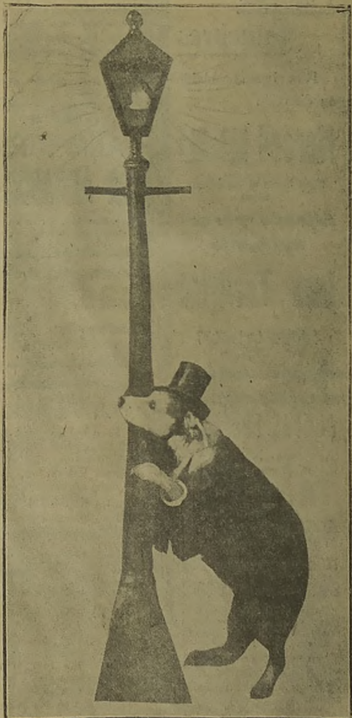
—¡Perdón, señor, no lo había visto!