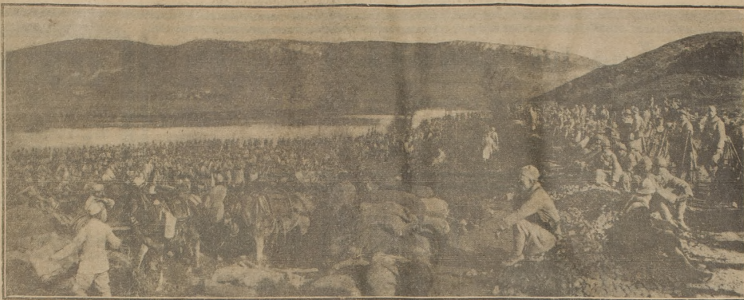
Tropas francesas recién salidas de Salónica con el fin de reforzar las líneas avanzadas del general Sarrail, vivaqueando en las orillas del río Vardar. —Todas las informaciones recién llegadas hacen suponer que, durante la presente primavera, habrá una gran actividad en las operaciones de los Balcanes.

cer de hambre; el proscenio de la más trágica de las escenas que arrancó a la realidad de su tiempo el soberano poeta de la divinidad y de lo humano, no existe desde hace más de dos siglos. Pero la imaginación reconstruye la torre fácilmente, inspiándose, allí donde estuvo, en la plástica energía del episodio dantesco. Las cosas circunstantes no se oponen a esa representación. Al lado veis el que fué "Palacio de los Ancianos", transformado, al gusto del Renacimiento, por Vasari, y convertido ahora en Escuela Normal. A la derecha, la Iglesia de los Caballeros, ocupa el lugar de lo que fué "Palacio de los Ancianos", transformado, al gusto del Renacimiento, por Vasari, y convertido ahora en Escuela Normal.