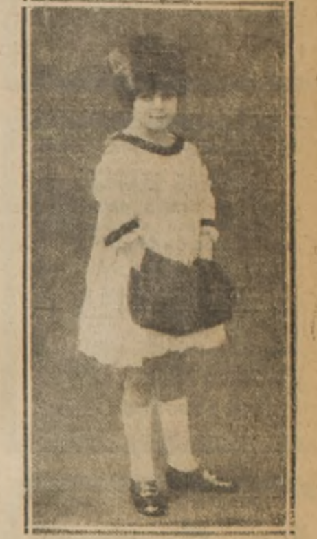
II. Traje para niña, de muselina de seda, color rosa, adornado con encajes de Bruselas y piel. Toca y manchón de Kalinsky.