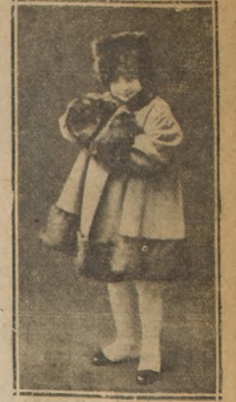
Traje para niña, de muselina de seda, color rosa, adornado con encajes de Bruselas y piel. Toca y manchón de la misma piel.