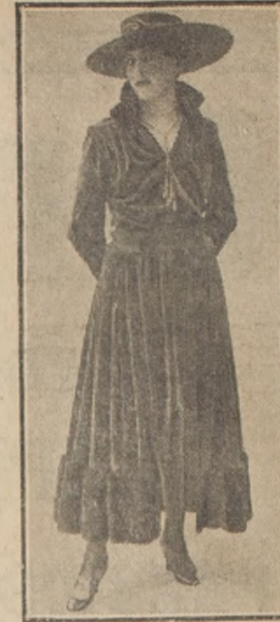
MODELO DE LA MAISON DOERFLEET

Traje de terciopelo color habana. Corpiño drapado y abotonado al lado; cuello de nutria, sostenido con un cordón de oro. La falda es recogida en los costados y adornada con una ancha tira de la misma piel.