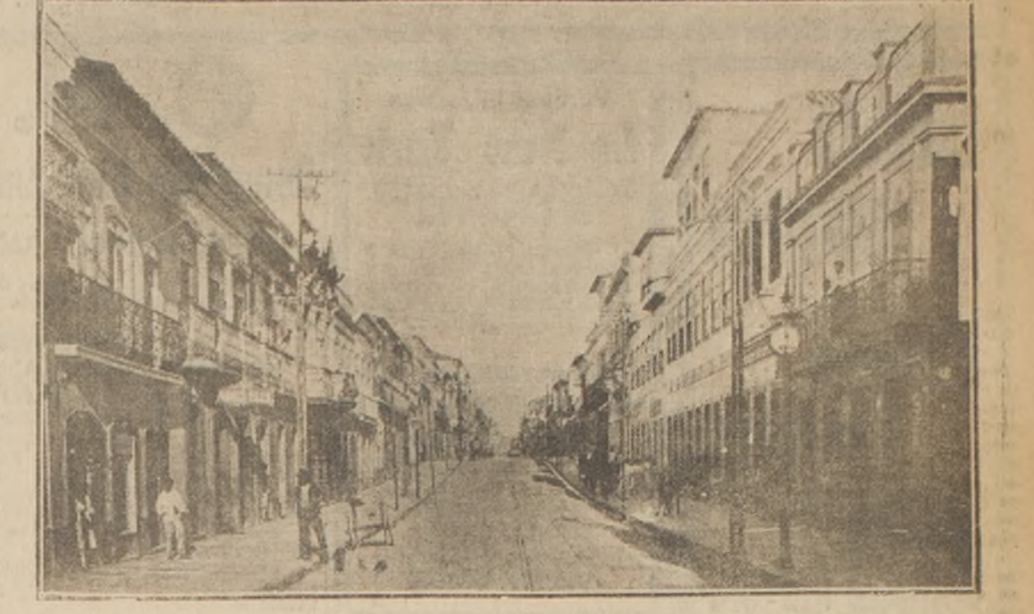
Calle Dos Andradás. Es el centro comercial de Porto Alegre y fué teatro de la mayor parte de los desastres a que se entregó la muchedumbre, contra las casas y los establecimientos alemanes.