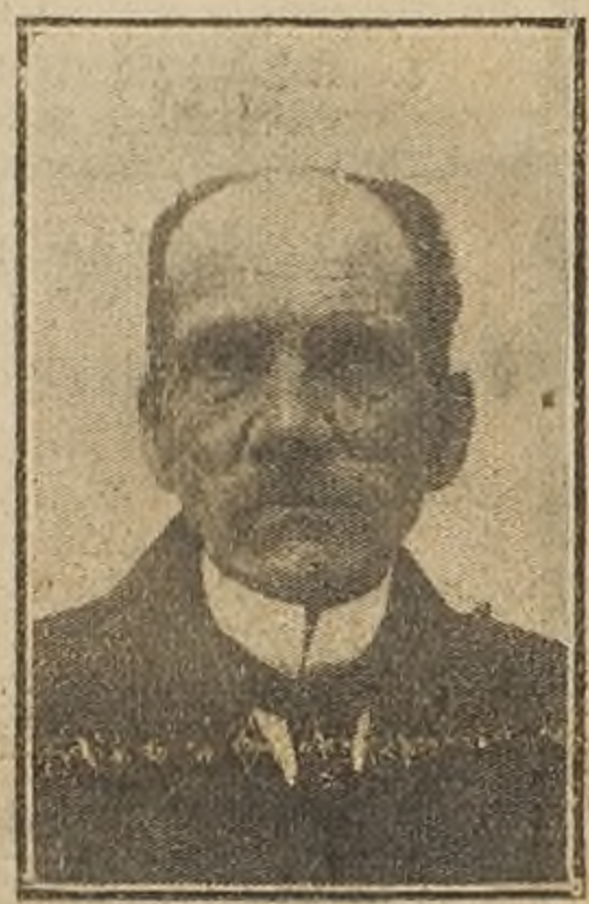
Don Augusto Orrego Luco

En su amable retiro de la calle de la Catedral, donde vive rodeado de sus libros favoritos, fuimos a sorprender al doctor Augusto Orrego Luco, a fin de inquirir de sus juicios la apreciación que le merecen los acontecimientos por que atraviesa nuestro país; en la hora acaso más peligrosa que jamás nos haya amenazado.