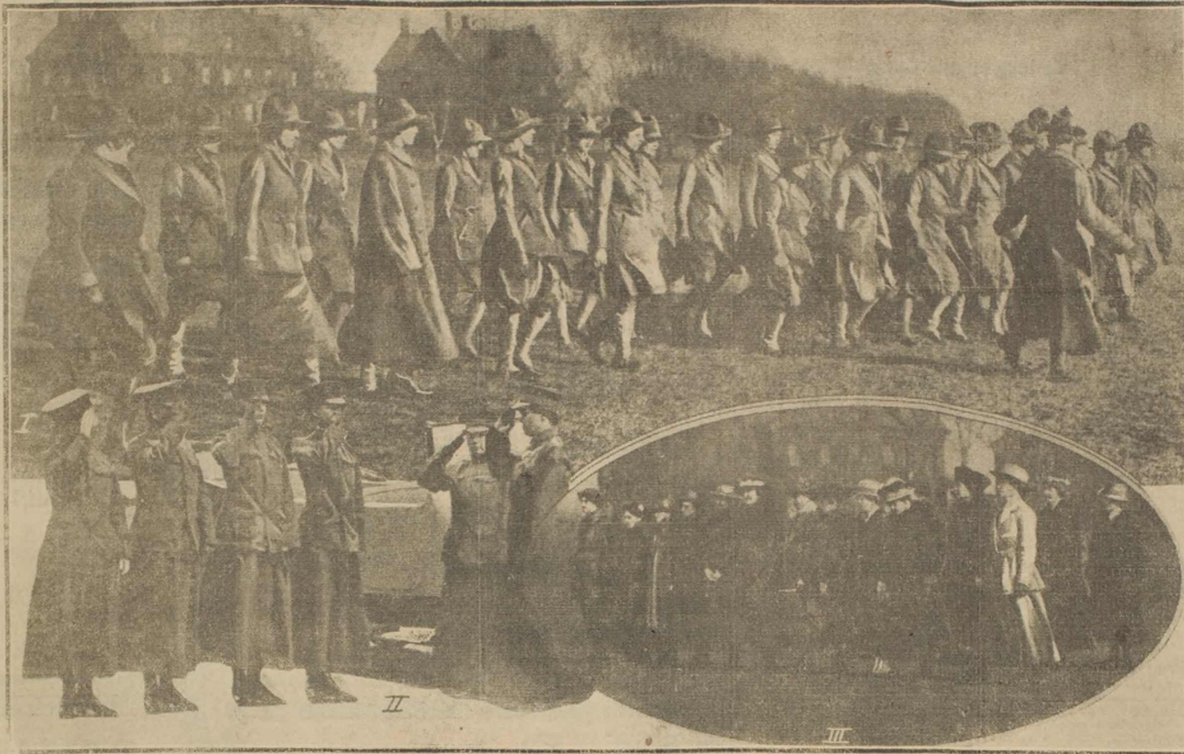
La Liga de Mujeres Americanas se encuentra muy preocupada de la guerra... Tanto, que sus socias están "entrenando" para la pelea, bajo las órdenes de un oficial del Ejército.