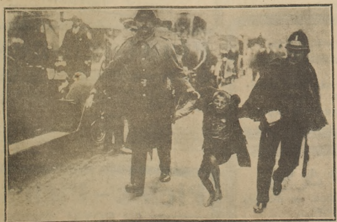
—Mucha "fuerza" para tanta debilidad, ¿no es cierto?