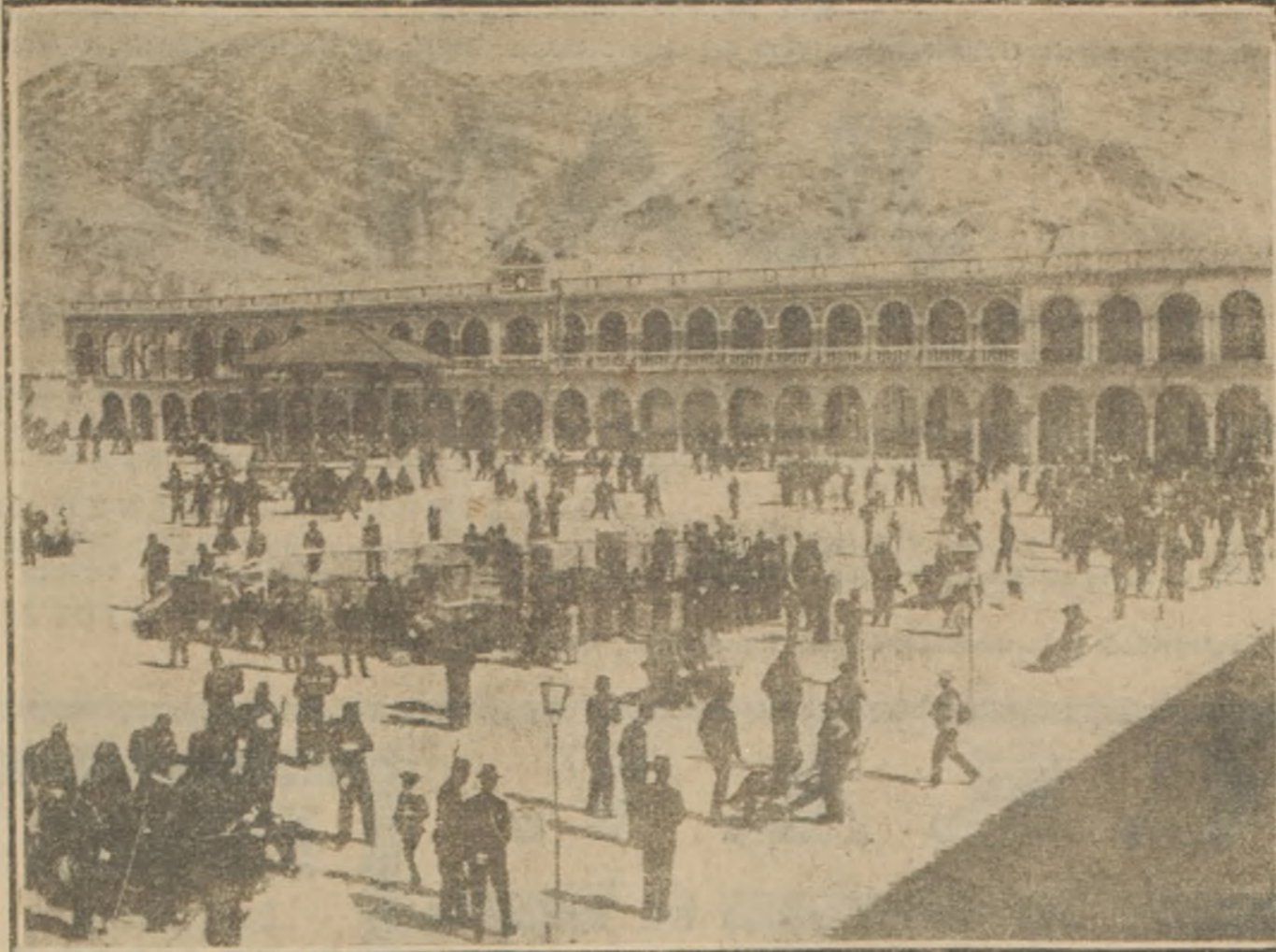
Plaza de la ciudad de Oruro, asiento de la revolución que se dice encabezada por partidarios del doctor Escalier, candidato derrotado a la Presidencia de la República.