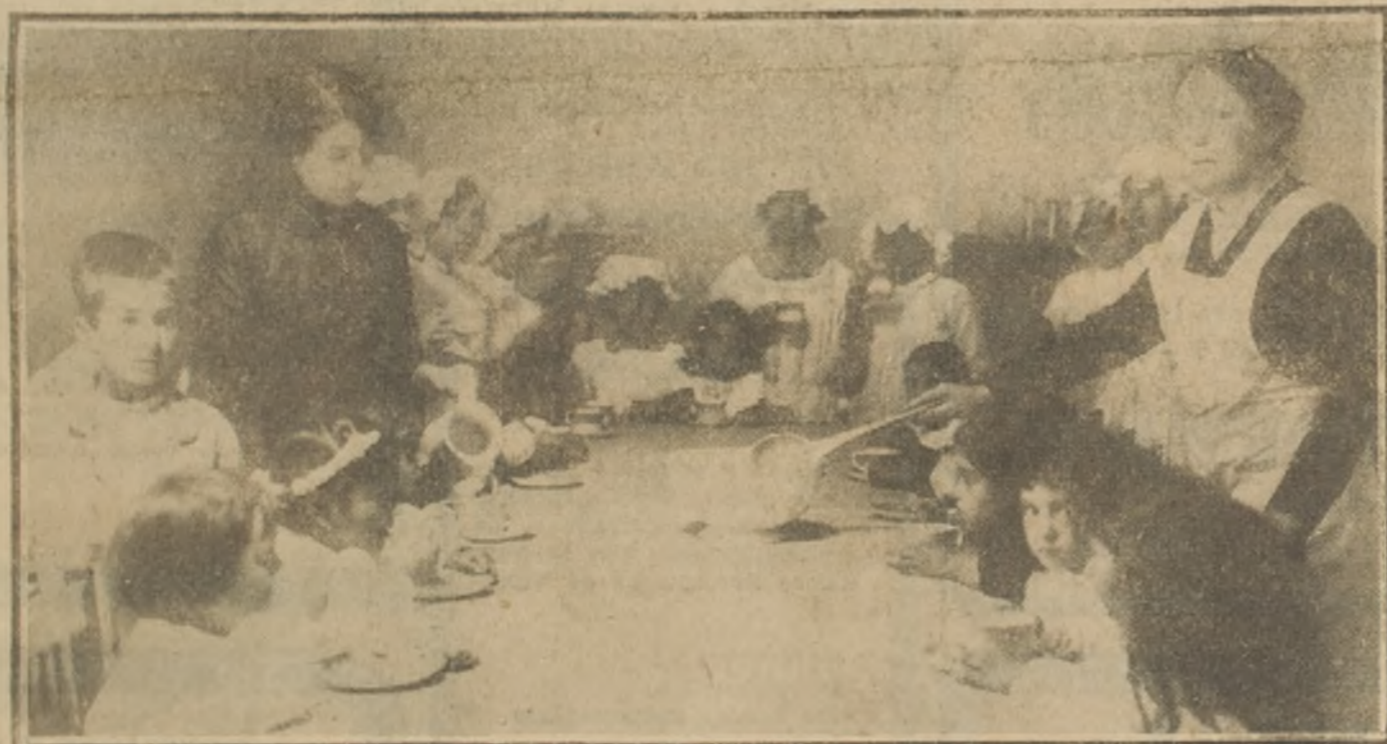
Desayuno en la cantina de la Escuela Superior N.º 2.

No hay duda de que en Chile han faltado, durante mucho tiempo, instituciones que agruparan a los alumnos de los establecimientos de instrucción después de terminados sus estudios oficiales, por así decirlo, para continuar el progreso intelectual de ellos o para comprometerlos a dedicar parte de sus actividades a obras de bien común. En los últimos años se han hecho grandes progresos en este particular; y es de esperar que se siga por ese camino. Entre estas instituciones merece especial mención el Patronato de