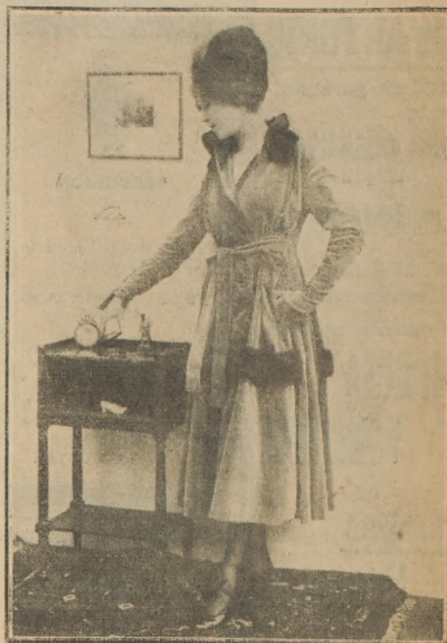
Elegante toilette de tarde de terciopelo gris taupe. Tiene como fin el adorno piel de renard gris. Botones y cinturón del mismo terciopelo.

PLUMBEROS Y ESCOBAS Estas son las principales armas con que se defiende a la casa de la invasión constante de polvo y bacterias, y se lo mantiene en perfecto aseo y, por consiguiente, en buenas condiciones higiénicas. No es indiferente usar cualquier plumero o escoba, ni basta con tener uno solo; por el contrario, se necesita tener en uso dos o más, según sea la atención y condición de la casa y menaje y para cada caso se requiere usar el tipo adecuado, tal como hace el buen obrero que usa una variedad de herramientas, una para cada labor especial. En las casas chicas bastará con dos escobas: una fina para las piezas alfombradas y otra más sólida y gruesa para las piezas de servicios y patios. Al barrer alfombras se evita mucho el polvo teniendo cuidado de desparramar antes hojas de té molidas, que en toda casa deben guardarse con este objeto y, además, tiene la ventaja que hermosa y rejuvenece a la alfombra. Cuando hay parquet, linoleum o pisos de mosaico, es conveniente tener un escobillón liviano y suave, y otro pesado y áspero. Si el presupuesto no permite adquirirlos, se puede substituirlos utilizando las escobas viejas, a las cuales se le recorta y empareja las fibras y se envuelve en un trozo de tela de lana y sirve, además, para sacar brillo al parquet, agregándole un poco de castoreo. Para los ladrillos de composición y linoleum se usa húmedo y después se da brillo con otro trapo con parafina; conviene tener preparados así dos o tres, uno para cada uso.