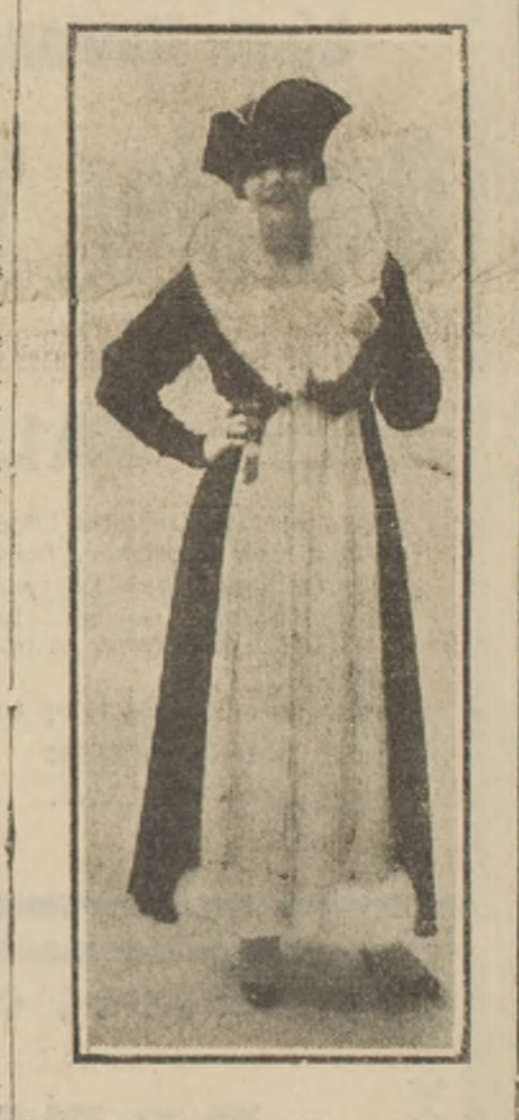
MODELO DE LA MAISON REDFERN

Traje de tarde estilo directorio, de terciopelo negro; el delantero es de muselina de seda blanca adornado con renard blanco. Sombrero de terciopelo negro. NOTAS SOBRE LA MODA Muchas mujeres creen que la elegancia consiste en llevar trajes exagerados o extravagantes, que sirven para llamar la atención y con ello sólo logran ponerse en ridículo. Para vestir con verdadera distinción, elegancia y chic, es preciso, ante todo, escoger la toilette que más se adapte a cada cual y sólo usar colores y adornos discretos, así, por ejemplo: Una mujer de baja estatura no deberá jamás usar el traje estilo "Tonnelet"; en cambio, la sentará admirablemente uno de estilo recto, logrando así alargar un poco la silueta. Rodfern ha mantenido el culto de la línea que siempre lo sedujo y lo