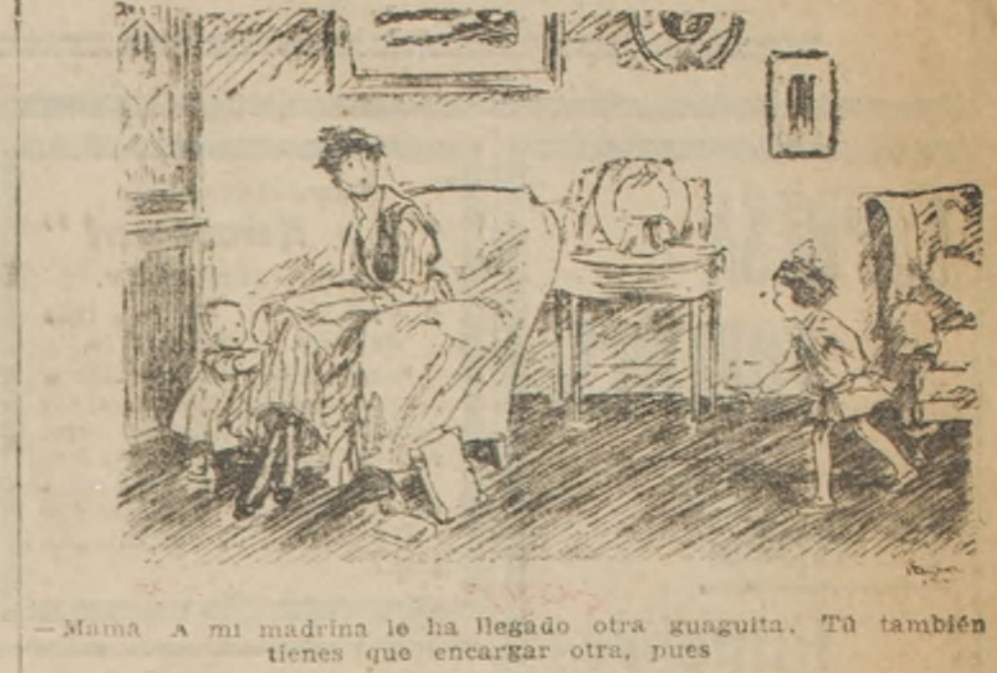
—Mamá a mi madrina le ha llegado otra guaguaita. Tú también tienes que encargarte otra, pues