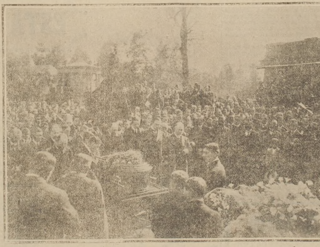
DURANTE LOS DISCURSOS EN EL CEMENTERIO