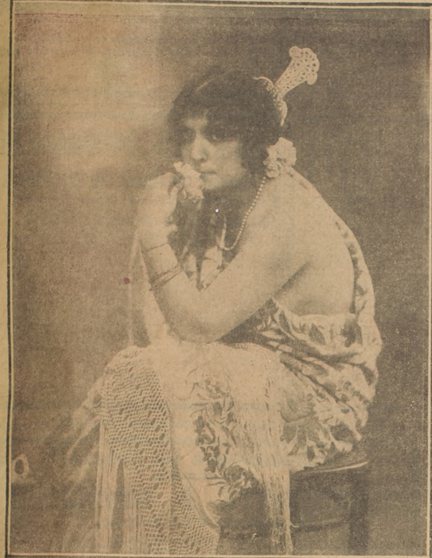
Regina Badet, que acompaña a Brulé en su gira por América. Mlle. Badet es una de las actrices favoritas del público de París, que la admira por elegante, por bella y por su exquisito talento artístico.