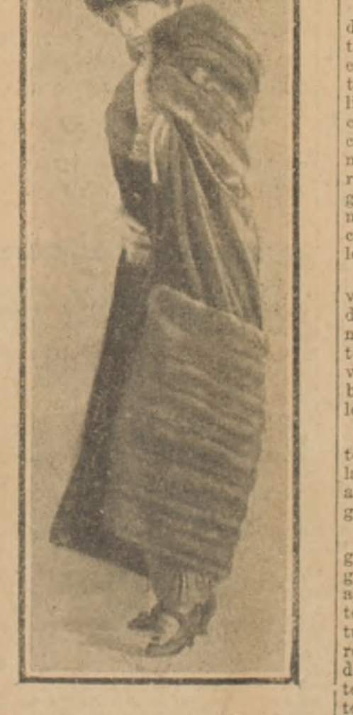
Elegantísimo abrigo de terciopelo color taupe, adornado con piel de visón