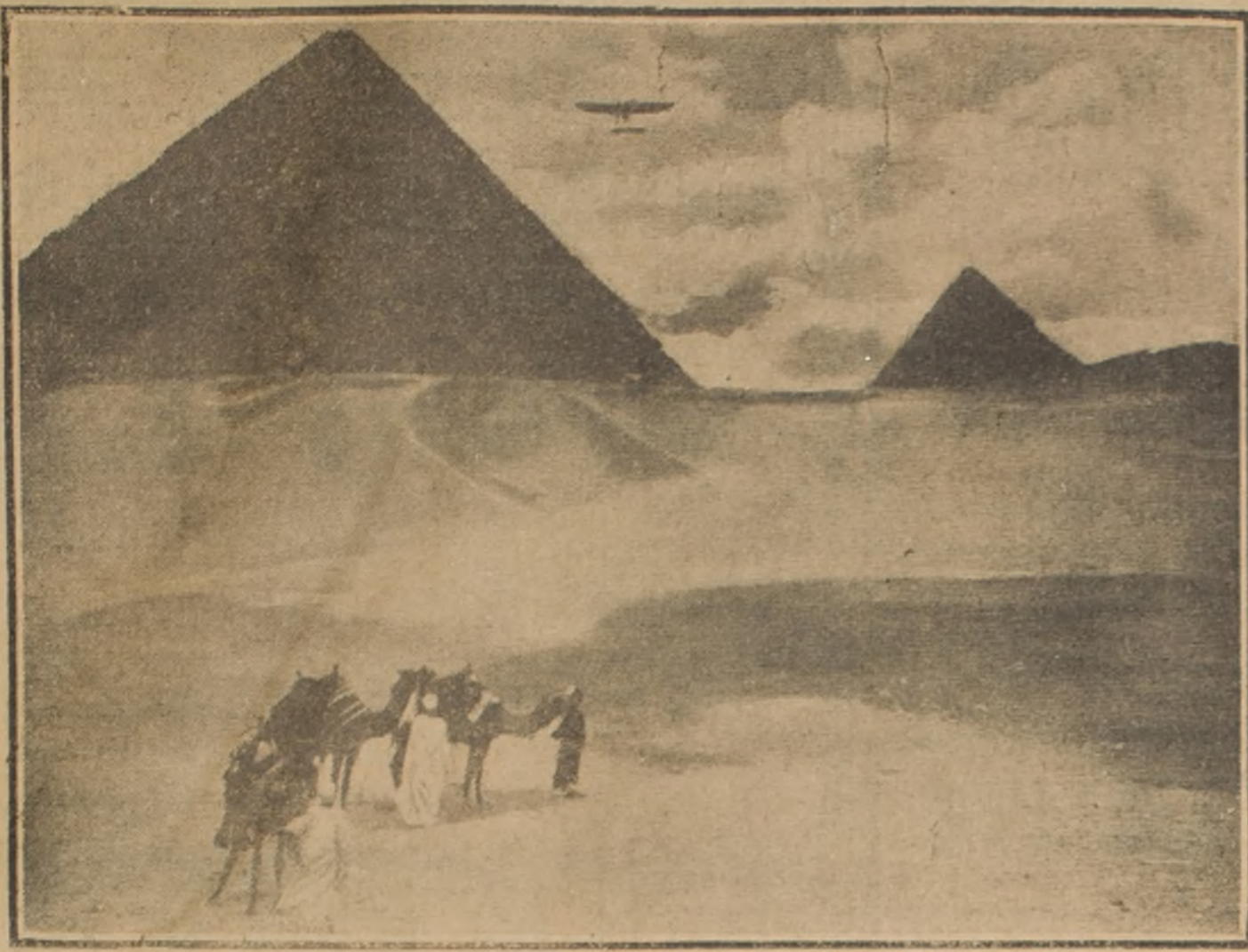
Profanando el misterio cien veces secular de las pirámides egipcias, un aeroplano nace en torno de ellas un vuelo majestoso.