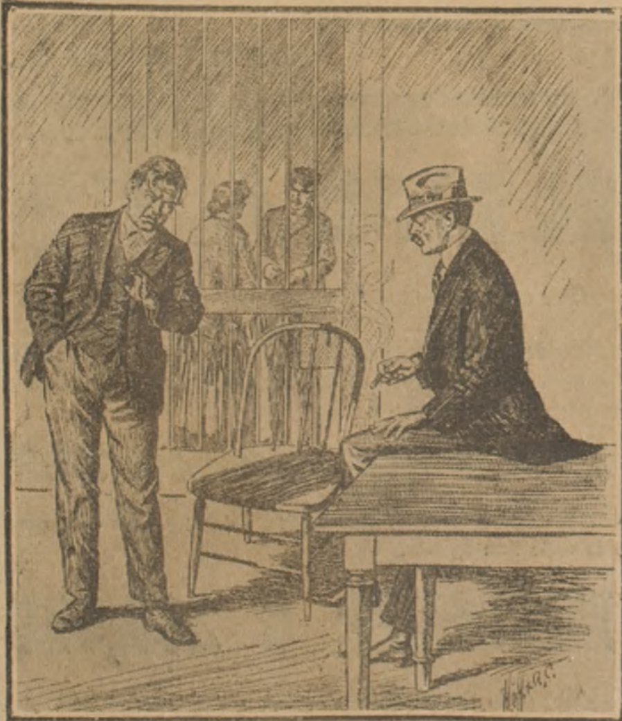
El abogado.—¿Cuántos testigos puede Ud. presentar para probar que andaban paseando en bote cuando le robaron su caballo? El cliente.—Habría que calcular cuántas personas cabían en el bote, pues, señor...