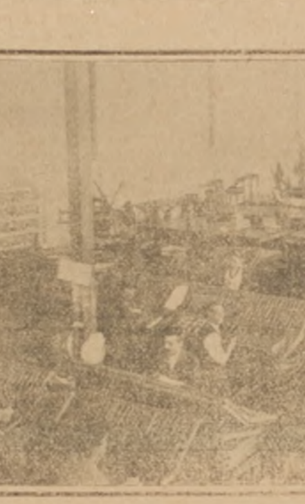
Sección tipográfica del taller de imprenta