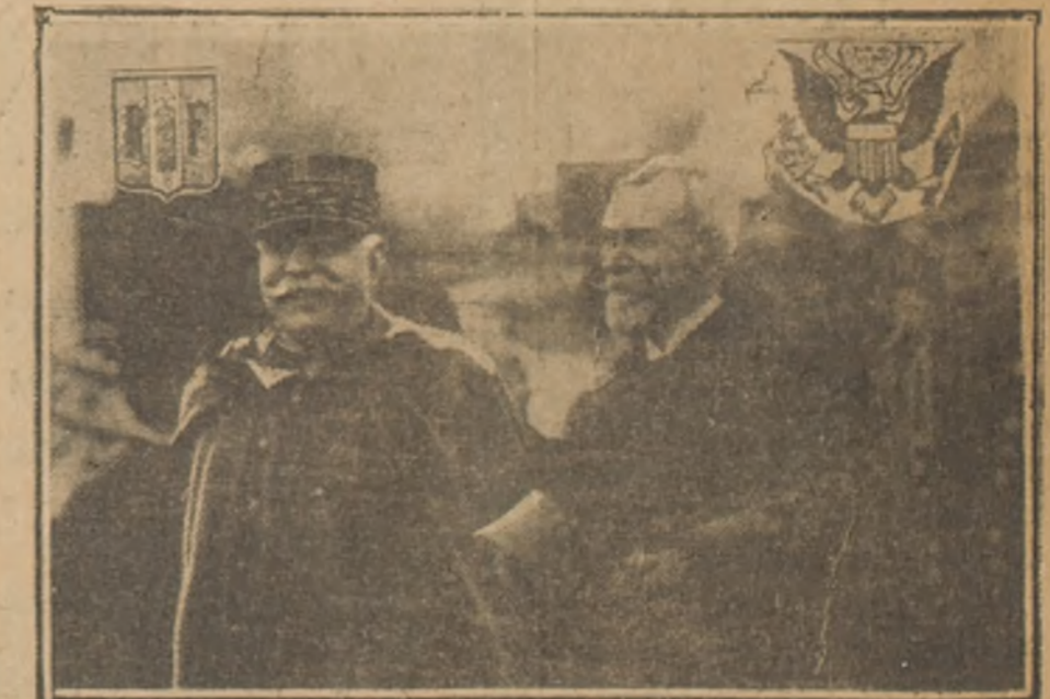
El mariscal Joffre y M. Jusserand, Embajador de Francia en los Estados Unidos, en momento de arbitrar a Washington la delegación francesa, encargada, con las otras comisiones, de estudiar y fijar la dirección económica y militar de la guerra.