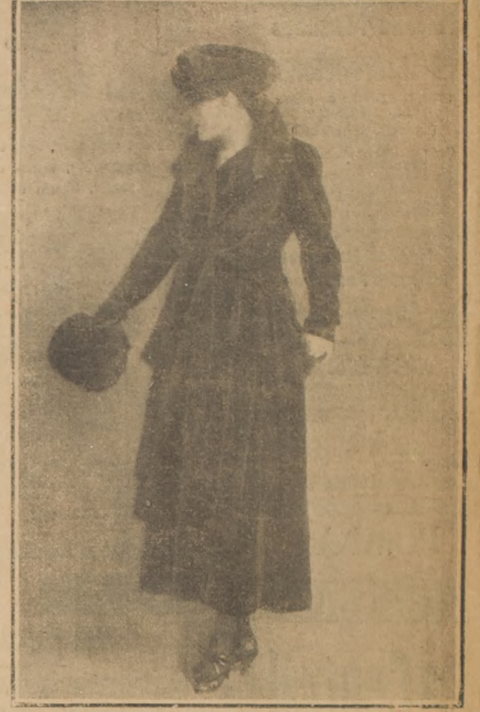
Elegante traje de tarde de terciopelo negro. La falda es recogida y formando pequeños bolsillos. Cuello de piel de putois.