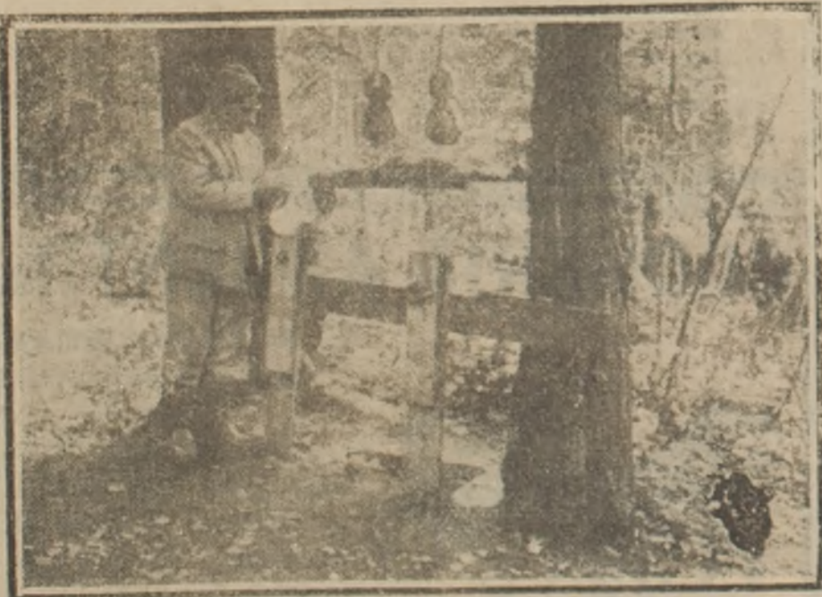
Un soldado francés, en el sector de Solsons, se entretiene en fabricar violines con los proyectiles del cañón de 75

Debido a la gran escasez de combustible en Holanda, como consecuencia de la guerra, se ha ideado en ese país un procedimiento para recuperar fácilmente los sobrantes de combustible de los hornos. Se dice que este valioso desperdicio forma a veces el 20 y llega hasta el 75