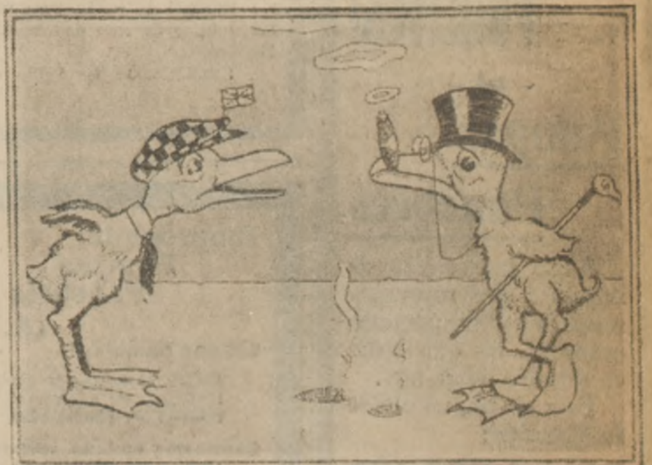
—Disculpe, señor; pero creo que su cara es conocida. ¿Acaso habremos sido huevos de una misma nidada?