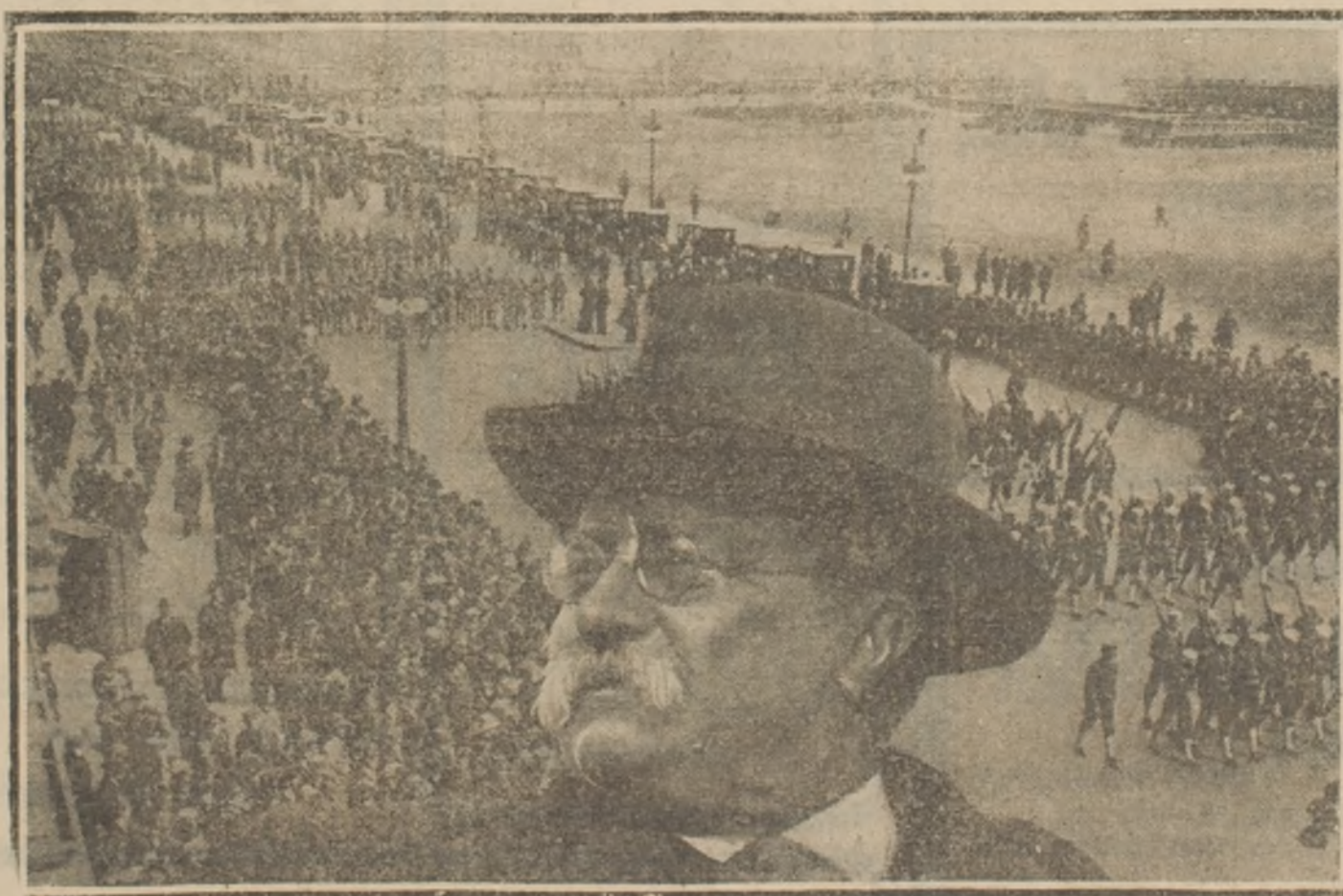
"Arm and Farm": "Armas y agricultura", tal es el lema con que el famoso coronel Roosevelt. Ha recorrido varias ciudades de Estados Unidos, proclamando la necesidad del servicio militar obligatorio, y la de cultivar intensamente los campos. Como se sabe, Mr. Roosevelt ha pretendido reclutar una división de voluntarios con la cual combatiría como quien dice, "por su cuenta", en las trincheras