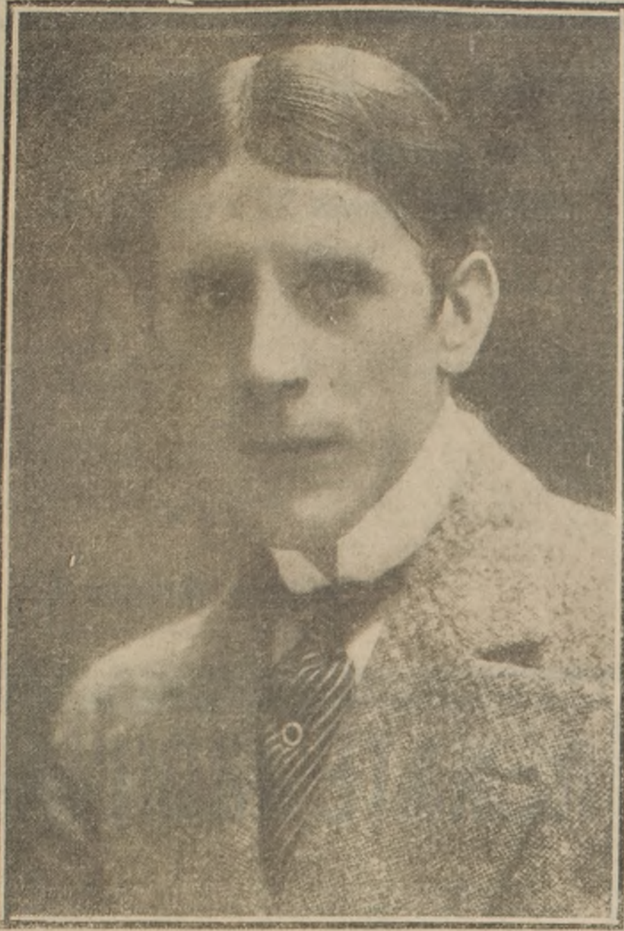
André Brulé, el célebre actor dramático que, en breve actuará en el Teatro Municipal