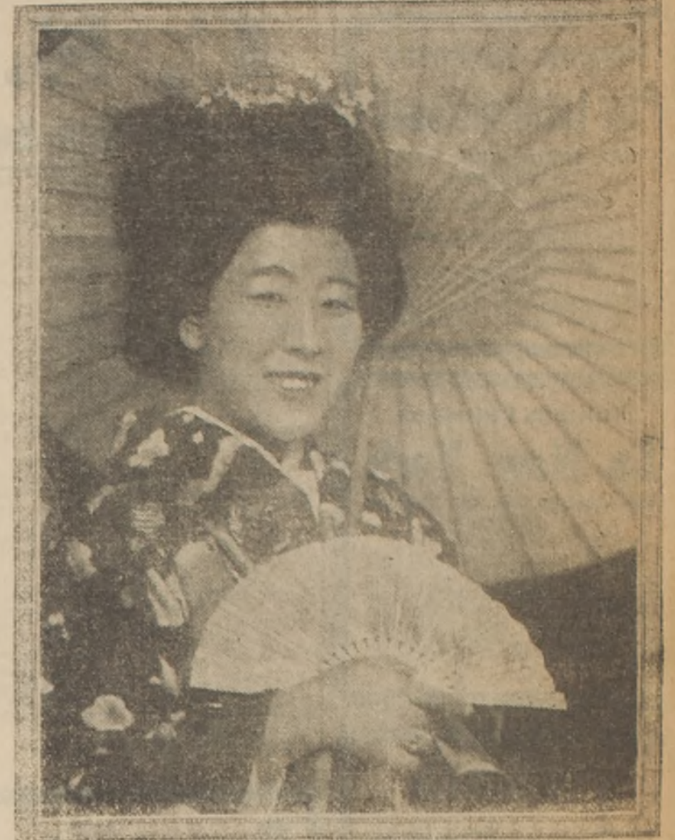
Es la más famosa prima donna del Japón. Su especialidad, naturalmente, Madame Butterfly

compás de espera. Ahora los polacos quieren nacionalidad propia, y con salida al mar... Nada menos.