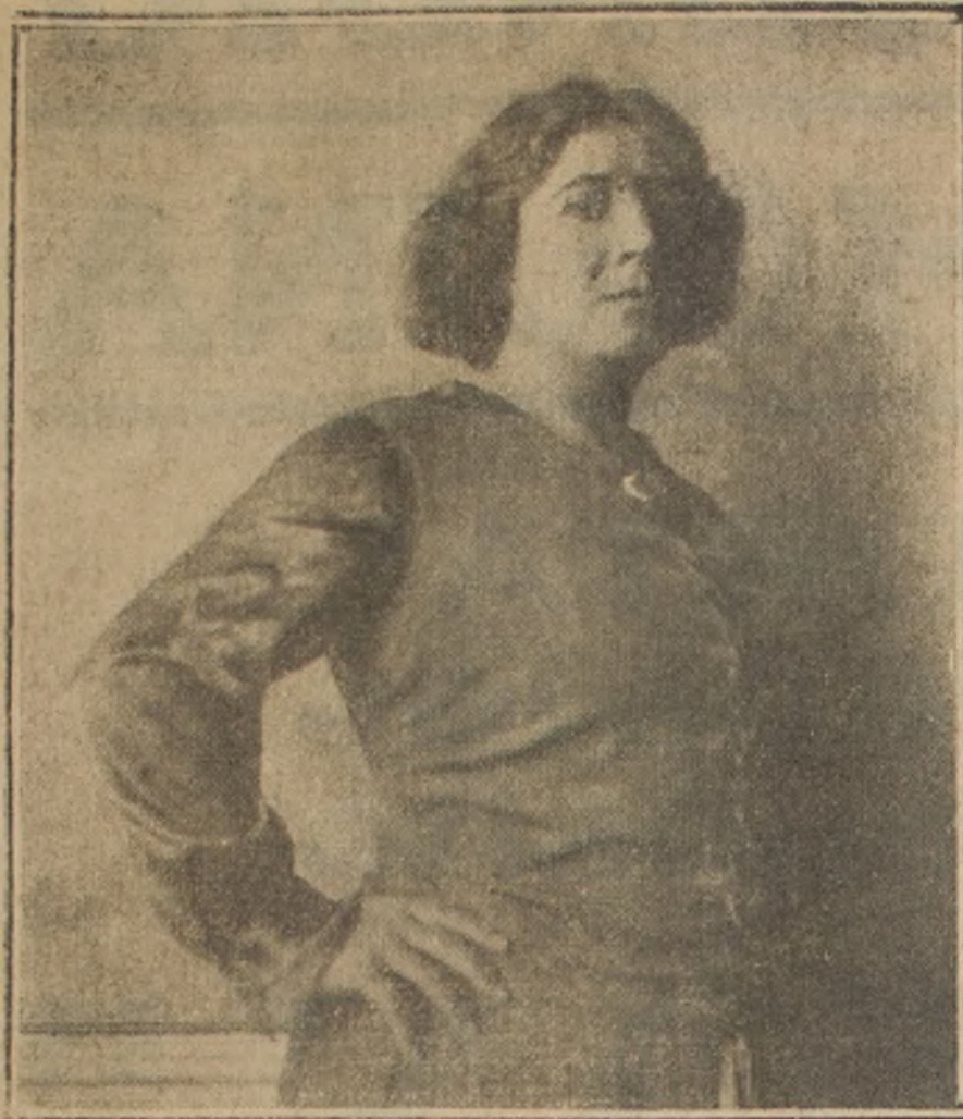
Esta embaite planista dará en breve un concierto, que ocupará el número 500 de los que ha dado.