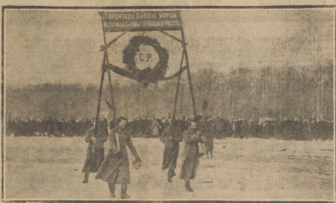
Durante una procesión patriótica, entre cuatro soldados exhiben y pasean una corona, con una inscripción con letras de oro sobre fondo rojo: "¡Podéis sentirnos orgullosos, luchadores caídos! La Rusa libre no os olvidará."

La primera es continuación de la de óleos, que tuvo amplia aceptación; ésta, sin haber logrado éxito, to semejanza, es de una importancia educativa indiscutible. Falta en ella quizá los matices que en la recordada Exposición del Centenario nos asombraron con la poderosa fuerza de color de aquellas acuarelas. Aquí campea también en gran mayoría que la acuarela misma, las aguaches, la pintura "a la vola", como diríamos en términos profanos.