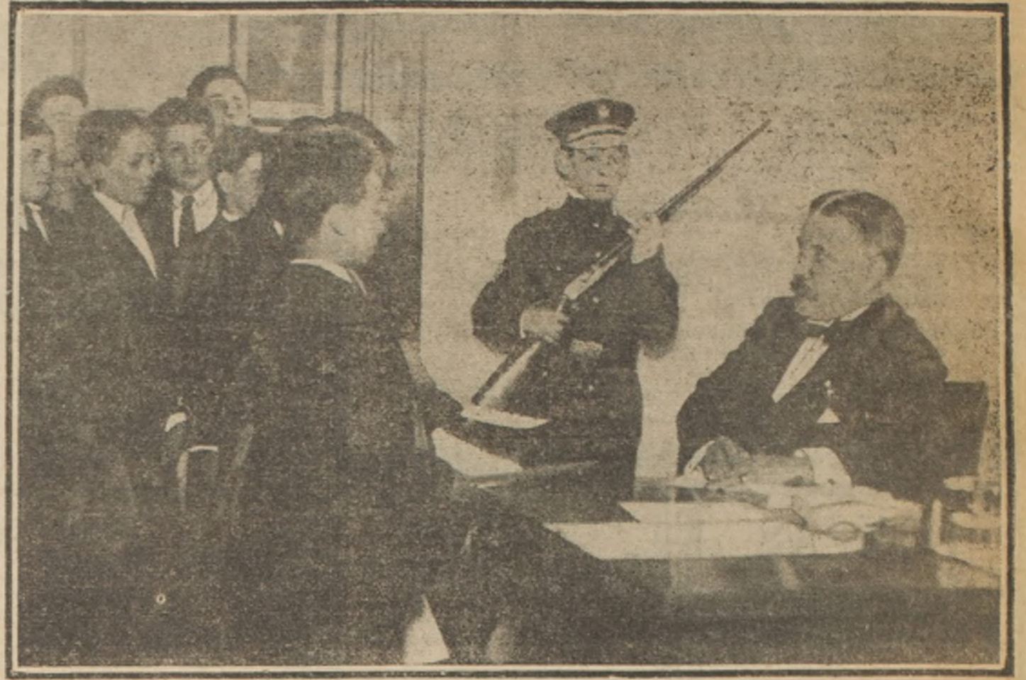
Los niños norte-americanos se inscriben en las listas de los cuarteles de la American Junior Naval and Marine Scouts

de la organización política de los pueblos ha seguido, de lleno inspirado en la sociología, le ha llevado a poner de relieve la importancia que a la población, al territorio y a la ciudad corresponde como parte integrante del Estado.