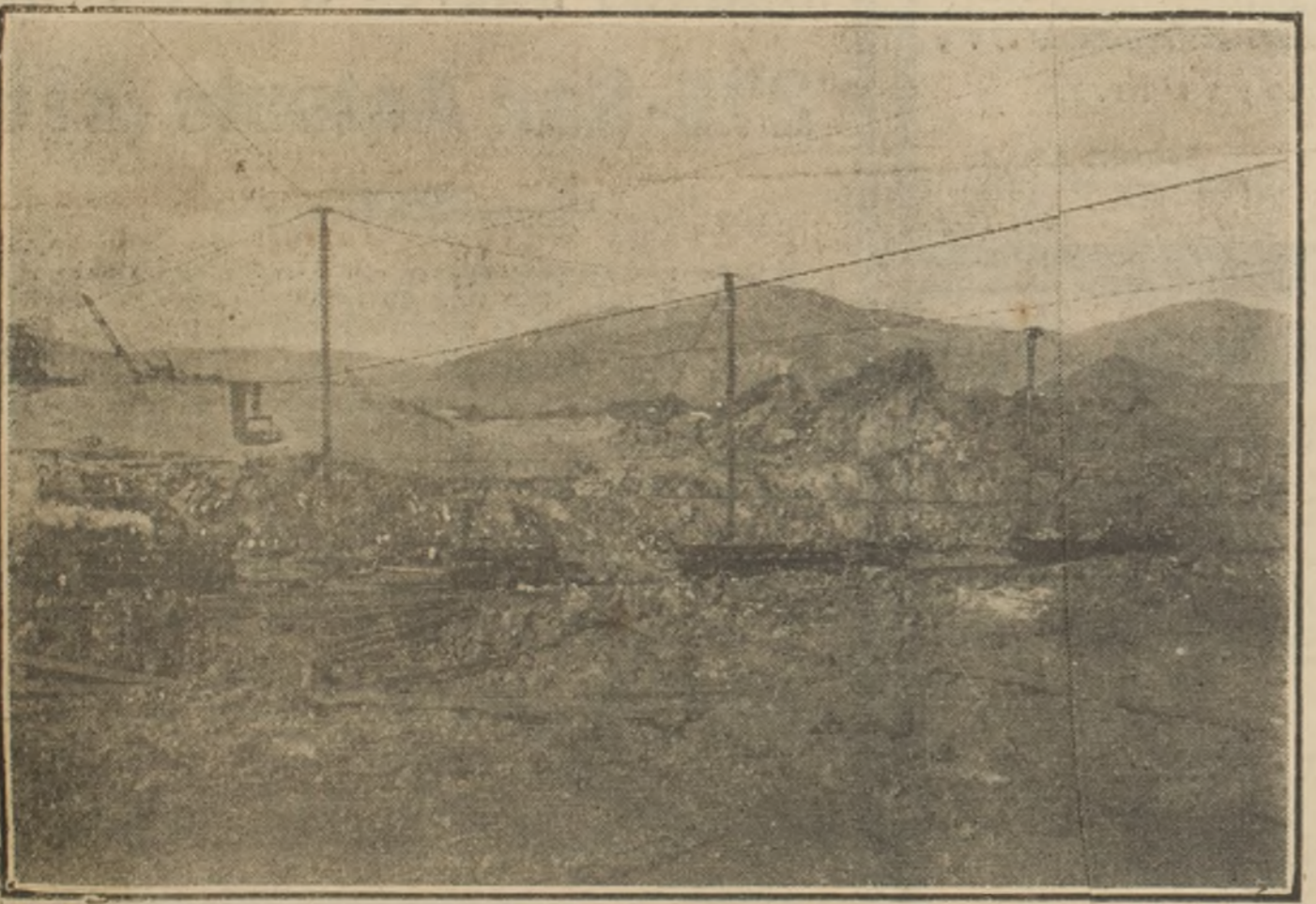
Arriba se ven carriles del andarivel y los pilares que accionan las chimeneas paameñas de transporte.

de 37 metros (o sea, 41 desde el fondo), y tendrá en su cara superior un depósito de minerales chancados de 35,000 toneladas, para cargar dos vapores al mismo tiempo. El acero empleado en él pesa seis mil toneladas, y su costo aproximado será de cinco millones de pesos. Al costado oriente se ha iniciado el trabajo de planificación de un depósito de mineral de un millón de toneladas