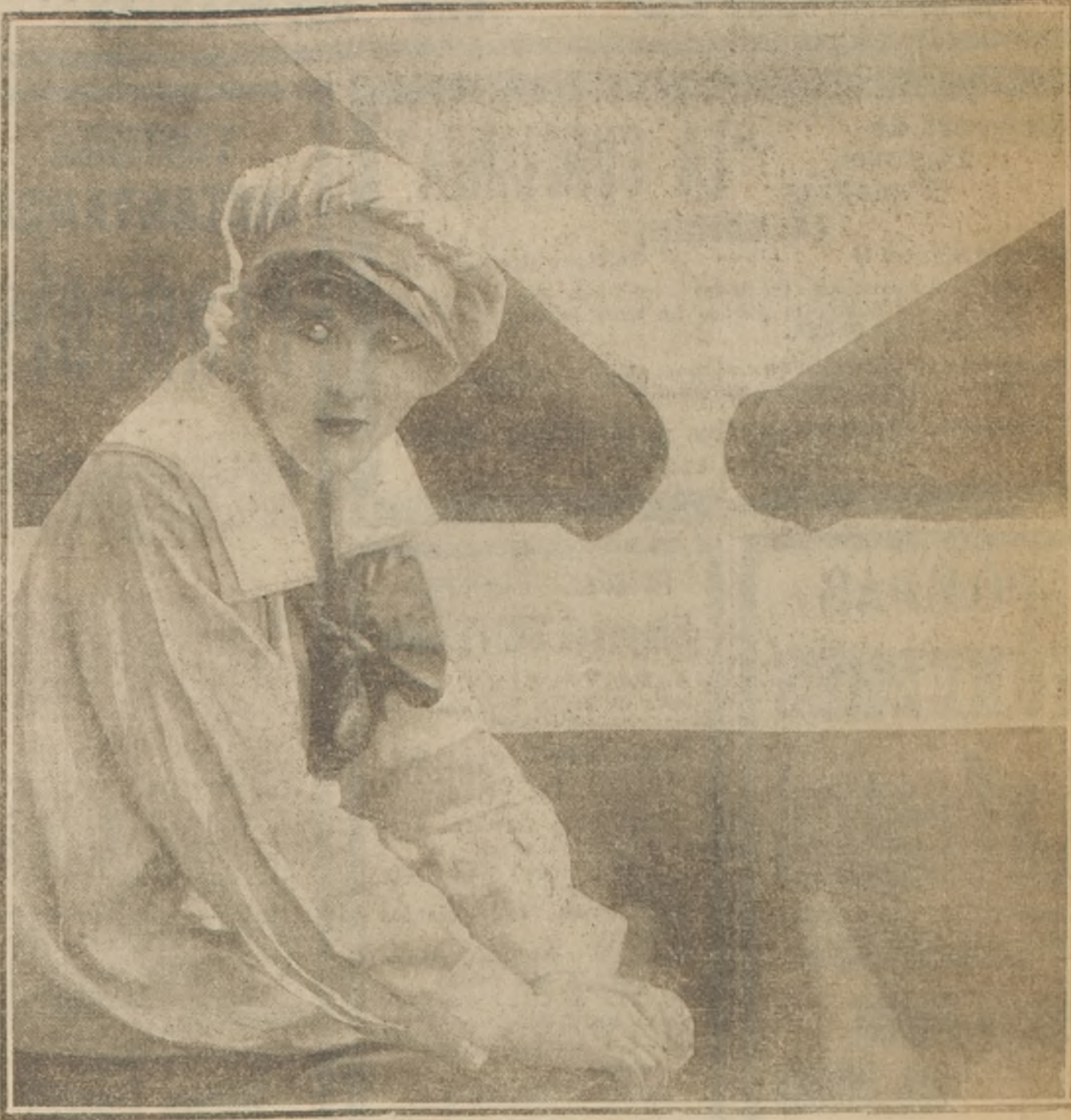
Miss Isabel Elsom, es una de las más simpáticas artistas del teatro inglés. Aquí se la ve vistiendo traje de marino, a bordo de un acorazado...

a la reserva y 25.000 a la caja de pensiones, los directores recomiendan el dividendo semestral acumulado sobre las acciones preferidas, y un dividendo del 5 por ciento menos la contribución a la renta, sobre las acciones comunes, haciendo un total de 7 por ciento para el año y dejando un saldo de 52.502 libras esterlinas.