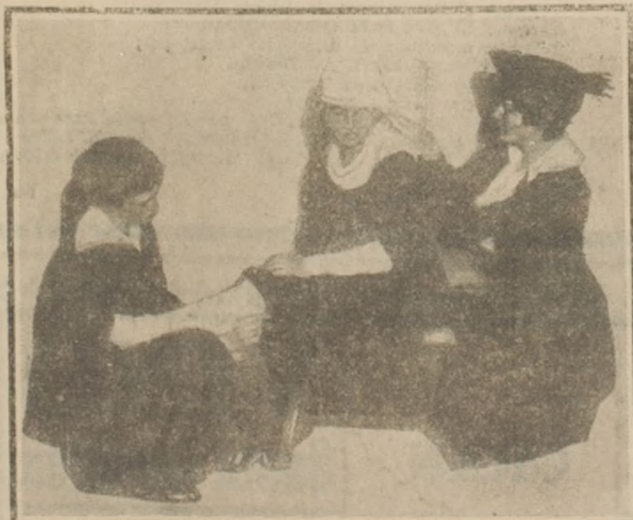
En la Universidad de Columbia. Algunas señoritas reciben lecciones de atención y curación de enfermos, para la Cruz Roja Norteamericana.