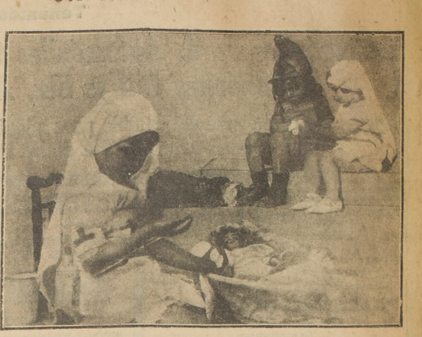
Como los niños juegan a los soldados, juegan a la Cruz Roja las niñas. Tanto han oído ellas hablar de esto; ven donde quiera elementos y medios de curación de heridos, que han caído, naturalmente, en la imitación. Consecuencia de la guerra. Los hombres se batían; las mujeres ejercitan la caridad; los niños imitan a los hombres; las chicas, a las mujeres.