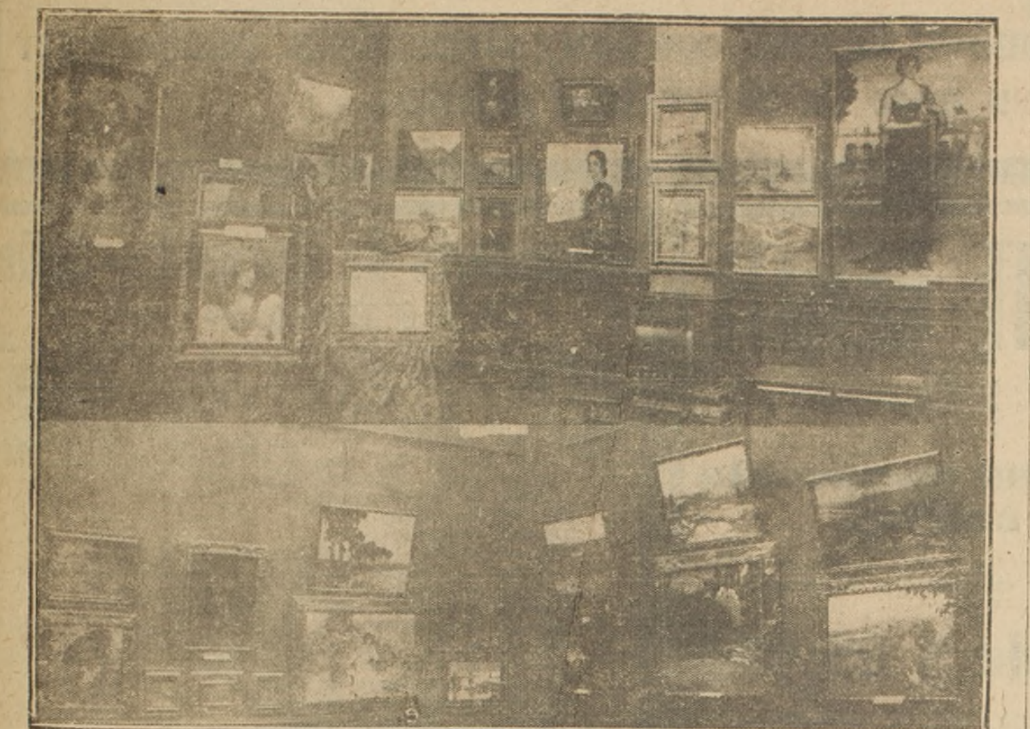
EN EL SALON DE LA CASA EYZAGUIRRE

posiciones francesa e inglesa que le han precedido. Por el contrario, no estaríamos distante de concederle, en su conjunto, cierta superioridad sobre alguna de ellas. Están, en efecto, representados en esta exposición los mejores pintores españoles de la época, con excepción de Sorolla y Zuloaga, cuya ausencia es explicable por la enorme demanda que tienen en Europa las producciones de estos artistas.