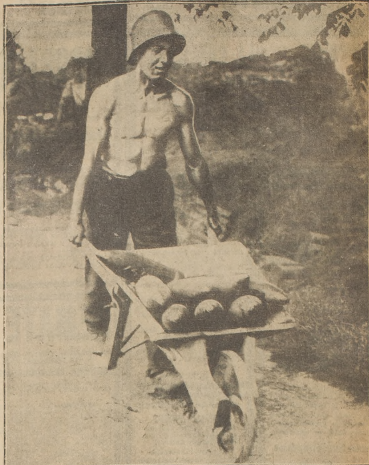
Cualquiera diría que éste que aquí se ve es un minero. A lo sumo, un peón de campo, bajo el sol torrido... Pues no, señor! Se trata de un "soldado" que va transportando municiones en las trincheras. La carretilla, erigida en instrumento de guerra!