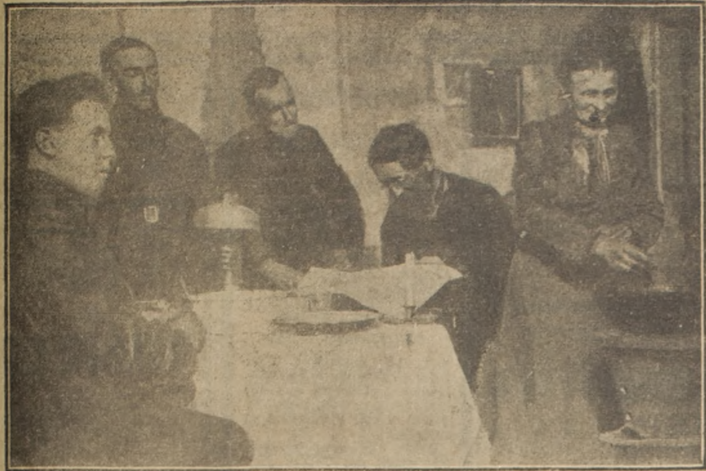
Hacia dos años que no llegaba a sus manos un diario francés