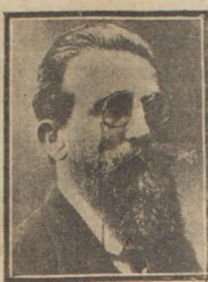
Don José Gutiérrez Guerra, nuevo Presidente de Bolivia

Celebra hoy Bolivia una de las fechas más memorables de su historia: el día en que hace noventa y dos años, la asamblea del Alto Perú, convocada por el General Sucre, proclamó su independencia consolidando así de una manera definitiva el movimiento de rebelión que se iniciara desde 1809, en la ciudad de La Paz. La aparición de la nueva entidad marcó en el continente sudamericano una conquista de la libertad y del derecho y constituyó un fenómeno de trascendencia para el equilibrio político de las repúblicas circunvecinas. El Mariscal Sucre fué su primer Presidente. Su historia registra toda esa etapa de convulsiones sociales que trae aparejado el nacimiento de un pueblo, pero afortunadamente las últimas administraciones han logrado realizar un camino hacia el progreso, estableciendo como base la paz orgánica e impulsando las comunicaciones ferrocarrileras, favoreciendo el auge de población y facilitando el desarrollo de las múltiples riquezas mineras que encierran las montañas del altiplano.