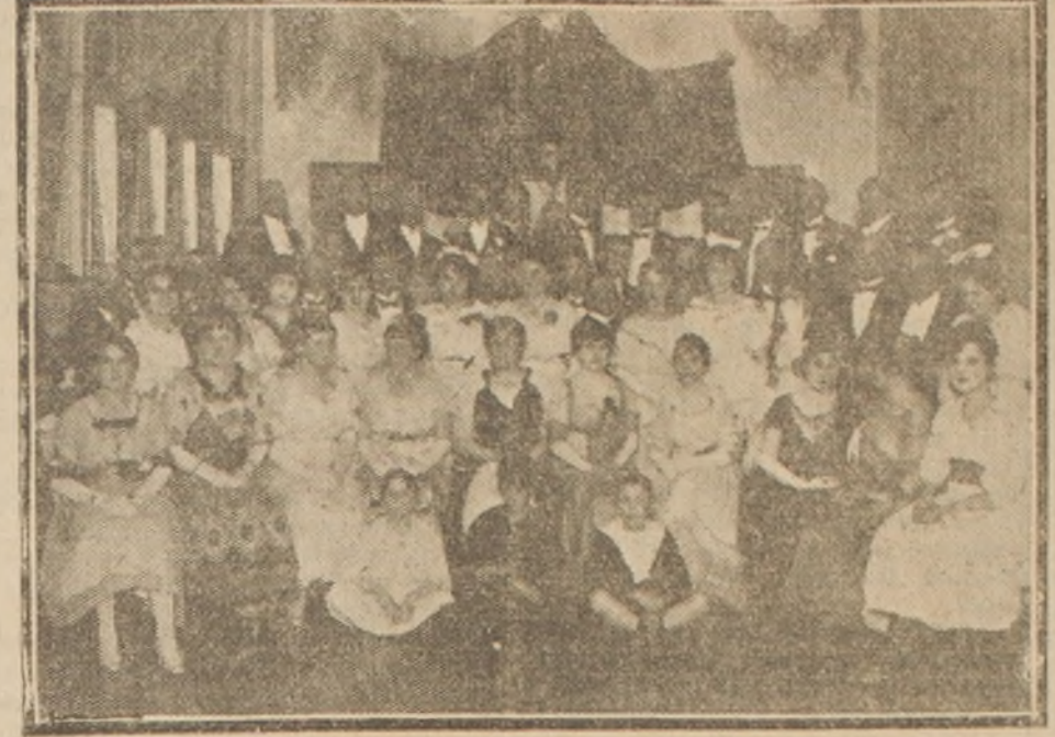
En el local de la Unión Helvética

Asistentes a la matinee. En un local de la Plaza Yungay se llevó a cabo ayer en la tarde la continuación de las fiestas que el Comité Suizo, con ocasión del 625 aniversario de la independencia de la Confederación Helvética, había organizado.