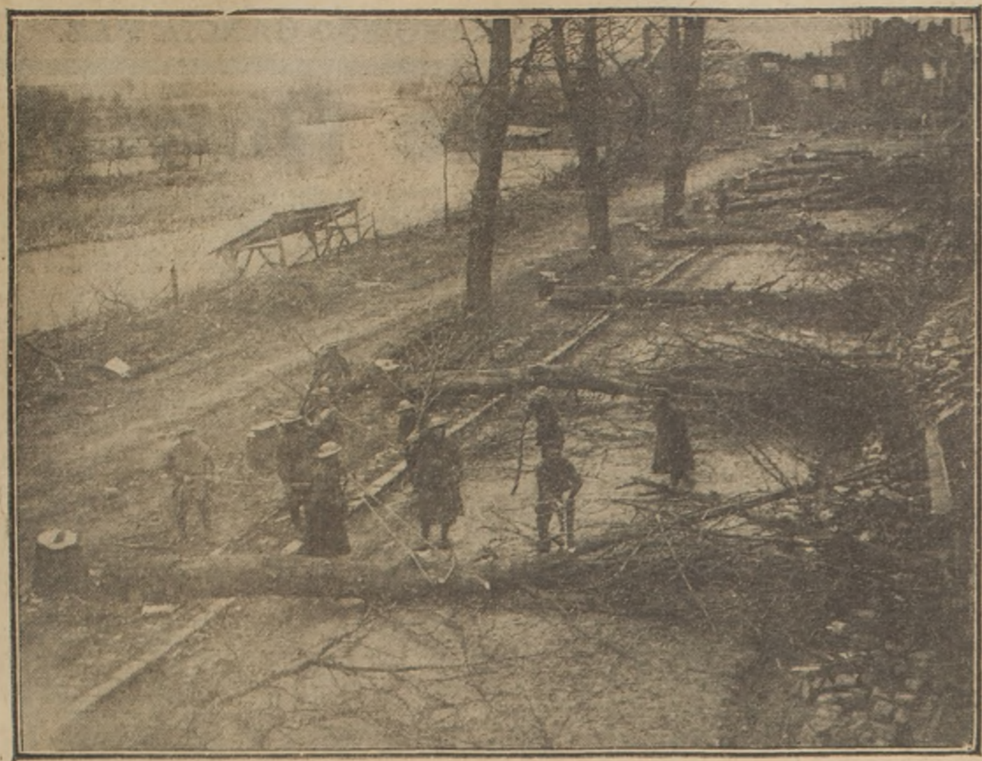
Sistemáticamente, como mandan las "órdenes competentes", se va haciendo la corta de árboles, en el camino de Peronne, durante la retirada alemana. ¿Cosas de la guerra!