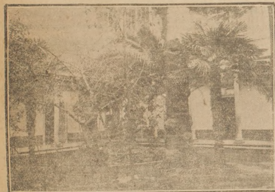
Uno de los patios de la escuela

una llave y los restos de una pila, estos que por cierto de nada sirven hoy día, a no ser de estorbo. Pero no es esto todo, quedan aún muchas otras deficiencias que no entraremos a enumerarlas, contentándonos a citar la que más perjudica tanto a profesores como