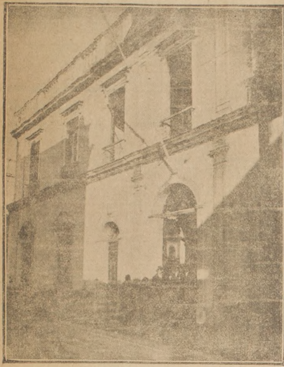
El local del establecimiento

Las que son las que hacen las veces de salas. Llaman la atención en estos patios, sus murallas polvorosas y manchadas por el agua de grandes goteras; sus corredores son angostos y mal pavimentados, carece en absoluto de sofás, los alumnos se ven por esto, en la necesidad de permanecer en los pasillos en el interior de las salas o salir a la calle para volver nuevamente a las horas de clase. El aula es sumamente escasa; solo el segundo patio cuenta con