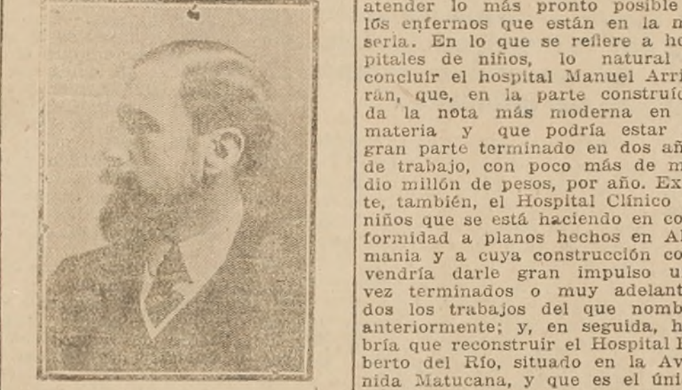
Sr. don Ismael Valdés Valdés

En la sesión del Viernes último del Senado, el señor Ismael Valdés pronunció un discurso que debió ser escuchado con la más grata satisfacción de todos sus colegas, por referirse a aquellas palabras a un interesante cuestionamiento que siempre ha presentado todo el carácter de un problema de trascendental importancia: la mortalidad infantil. Dijo el señor Valdés que ésta había decrecido en un porcentaje bastante halagüeño. Según la estadística—manifestó—la mortalidad de niños menores de un año es de 248, por mil nacidos, es decir, que antes de cumplir un año