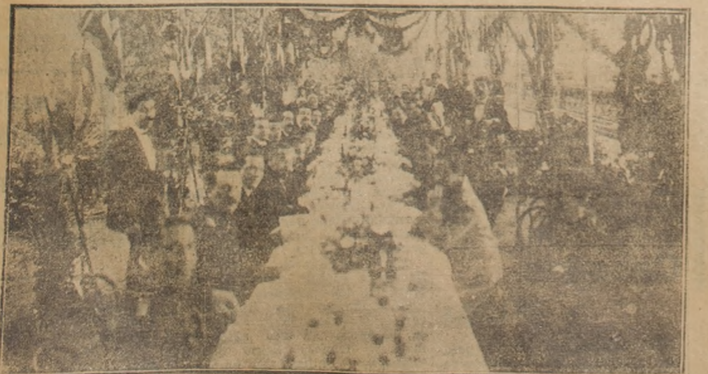
Asistentes al almuerzo en el Cerro

Y para que las hermosas palabras que hemos dicho en estos días no sean como estas flores primaverales que se deshojan, aunque para volver en su estación, ni como las nieves que se deshelan, aunque sea para recongelarse, ni como esas cigarras cantoras de los soles de Grecia, que una sola neblina basta para matar; como dijo el poeta, miremos sólo, desde este peñón, cómo es empresa fácil de dominar la columna humana de