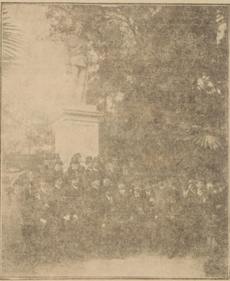
Al pie de la estatua de Pedro de Valdivia