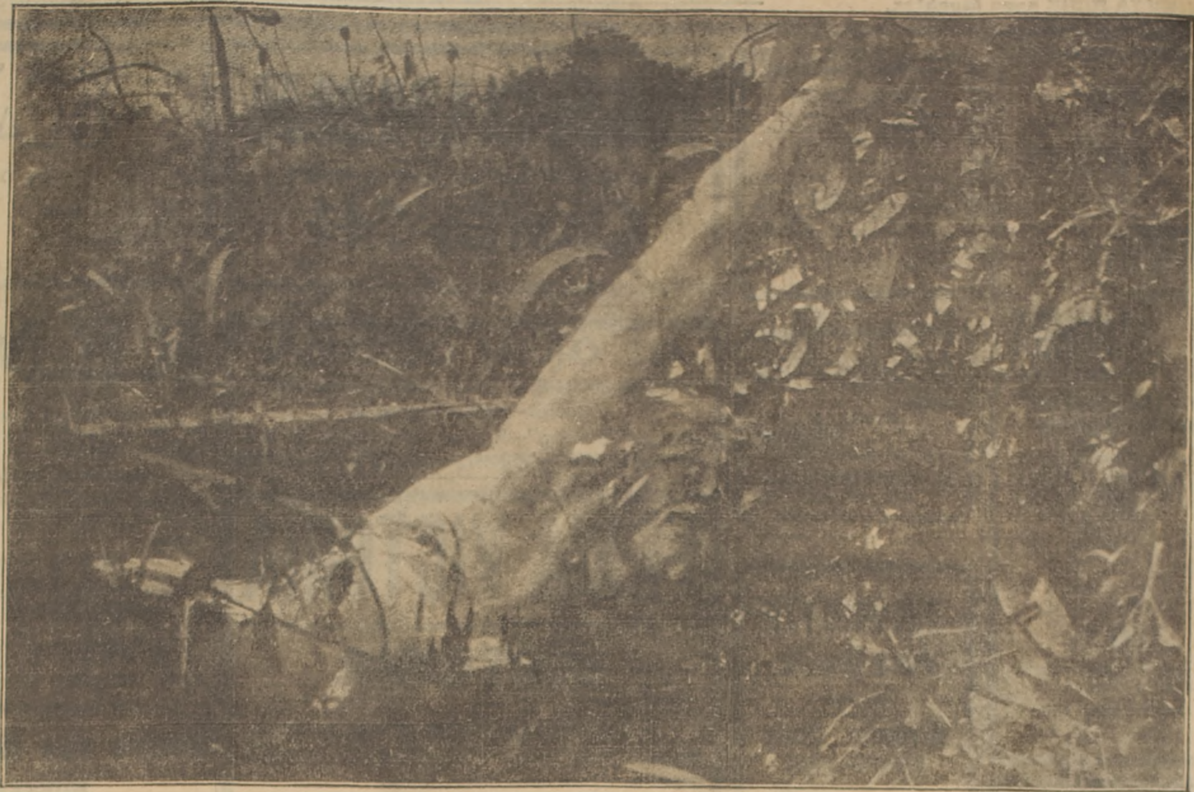
Esta fotografía fué tomada en la aldea de Ly-Fontaine (al sur de Saint Quentin), aldea que fué destruida por los alemanes en su retirada de Marzo último.

La consulta de los Leblond establece una verdad. El pueblo alemán no hará revolución. Puede haber tumultos causados por el hambre, pueden producirse desórdenes locales originados por conflictos de trabajo, pero está fuera de toda posibilidad actual un movimiento político tendiente a un cambio de régimen. Para un movimiento así sería menester una transformación total de la mentalidad alemana, y no veo qué influencia espiritual y moral podría determinarla.