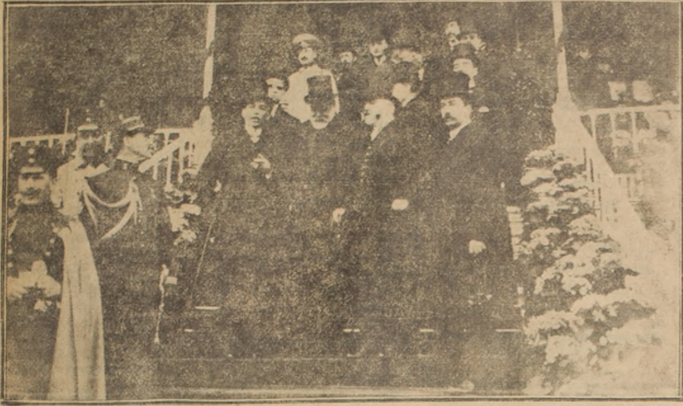
Los Embajadores y el Ministro de Relaciones, en el Club Hípico

afecto intenso cada vez que vemos flotar vuestras banderas, resonar vuestros himnos y llegar por el telégrafo las buenas o malas nuevas de vuestras ciudades, los que os hemos querido festejar hoy día en este poético rincón, propicio para las frases de amor, predilecto de esa época pasada en que el rumor de las risas juveniles de las ro-