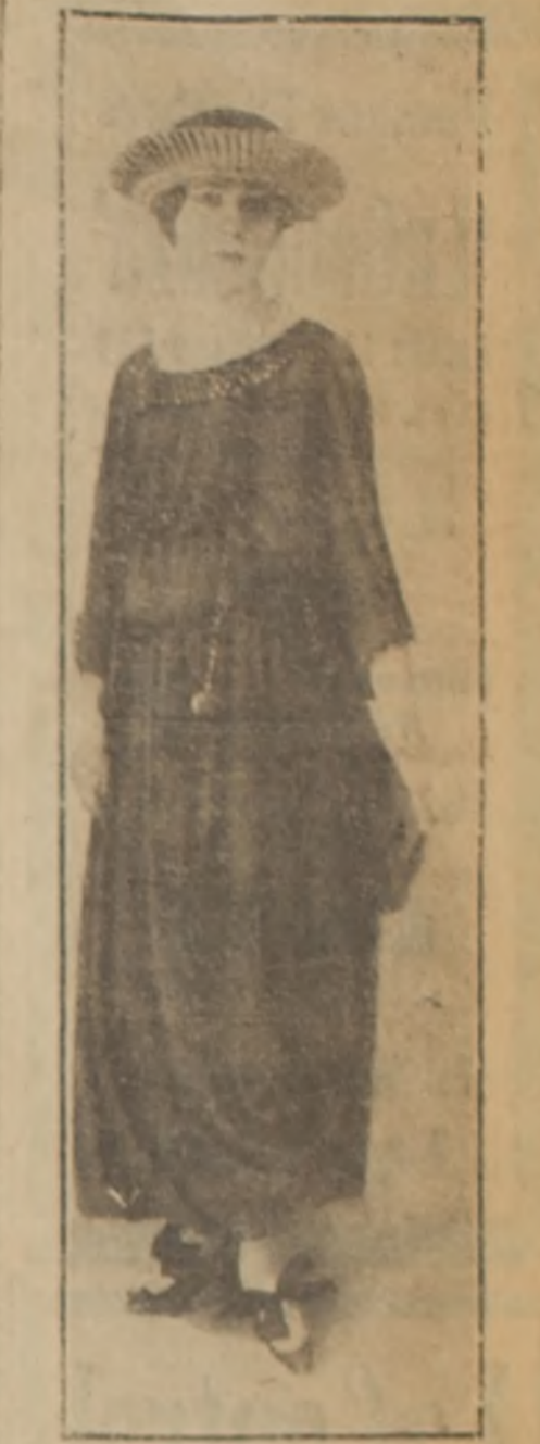
Traje estilo "Dimitrios", de crêpe Georgette azul marino. Las mangas y los bolsillos son de velo rojo vivo y bordados de pequeñas mostacillas cereza. Sombrero bretón de paja gruesa azul con cinta plegada.

Parece que el pez más fácil de conservar es la carpa. Este pescado puede conservarse por largo tiempo en estanques de agua salada. En Escocia, según cuenta Jarroll, a medida que los pescaban, elegían a los que estaban menos heridos y los colocaban en los depósitos destinados a ello, donde se les alimentaba con marisco. Conocían la hora en que se hacía el reparto de la ración, que recibían con ansia sacando la cabeza fuera del agua. En esta condición vivió un bacalao más de doce años, porque comen con facilidad y mandan visiblemente, aunque tengan muy poco espacio para moverse. Lo único que necesitan es el que el agua esté siempre fresca.