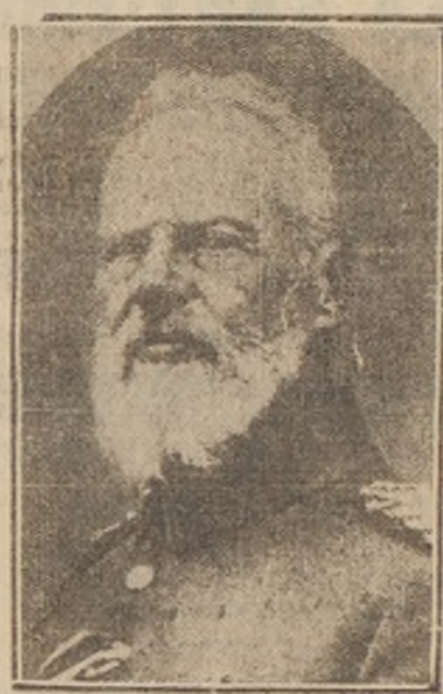
Las tropas que comanda este príncipe han obtenido tales éxitos, que, según anuncia el cable de hoy, los rusos han ordenado preparar la evacuación de Riga.

que antaño vinieron de Holanda para secar y convertir en llanuras fértiles las pantanosas márgenes del Mottlau. El "Mercure de France", que refiere la historia de esa extraña tribu protestante, dice que sólo estaba sometida al impuesto de la defensa nacional (Wehrsteuer). En el transcurso de las guerras del primer imperio, los menonitas facilitaron grandes cantidades de dinero al Gobierno prusiano. En cambio, los que voluntariamente se alistaron en el ejército, fueron excluidos de la comunidad.