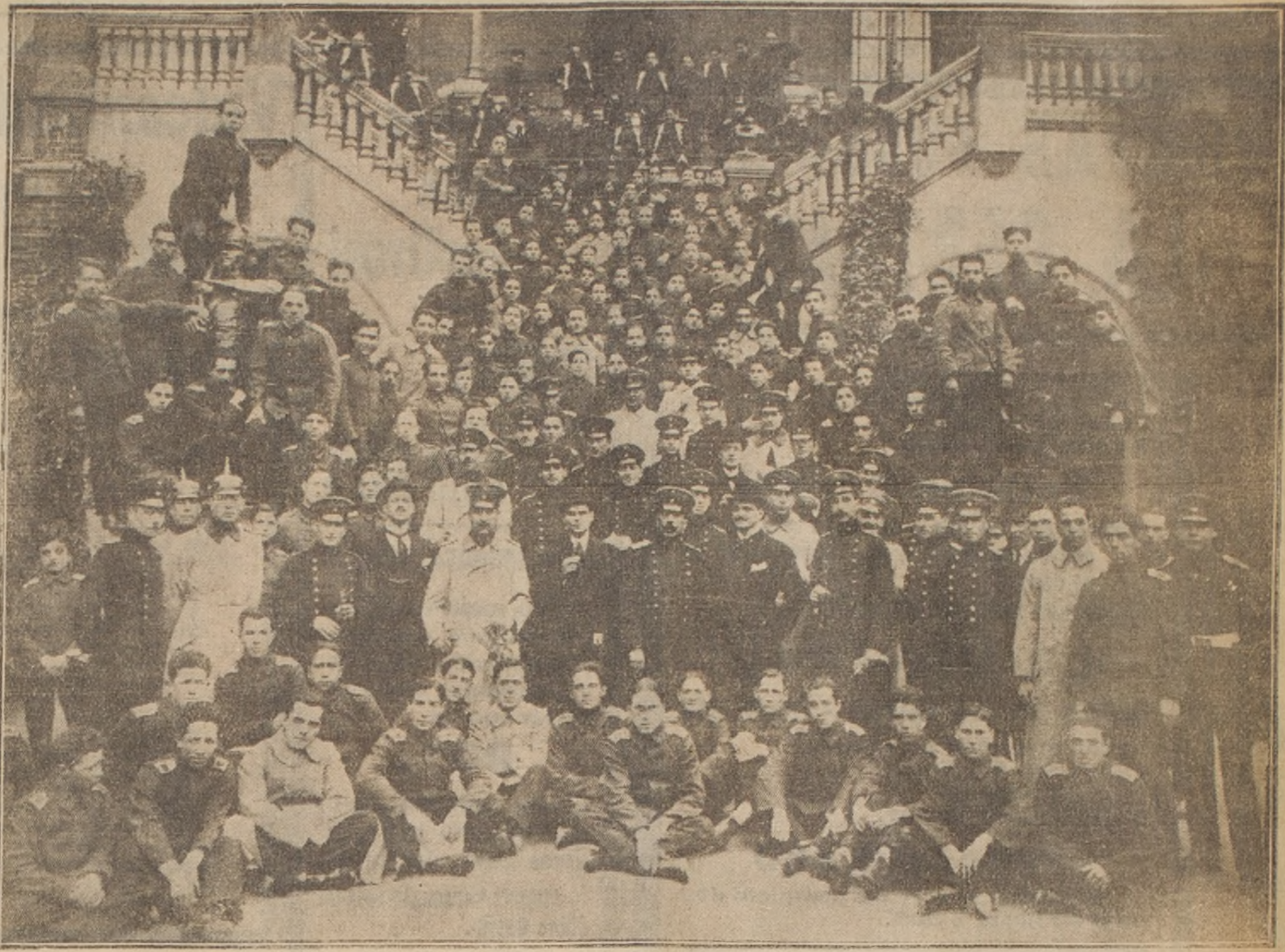
VISTA GENERAL TOMADA EN LA ESCUELA MILITAR EL DIA DE LA RECEPCION OFRECIDA A LOS MIEMBROS DE LAS EMBAJADAS EXTRANJERAS

Japón es el país ideal para las muchachas cuyos encantos son principalmente espirituales, y, por consiguiente incapaces de proporcionarles un novio a simple vista. Debemos añadir que desde que la "civilización de los occidentales", ha ido a despertar el alma japonesa, dormida en sus jardines liliputienses, sus tradiciones y sus casitas de papel, han sido concedido a las pequeñas "mismas", el derecho de cambiar con sus novios unas miradas y hasta unas palabras antes de que la boda sea celebrada; no ya por tres tazas de "saké", sino por sacerdotales de carne y hueso.