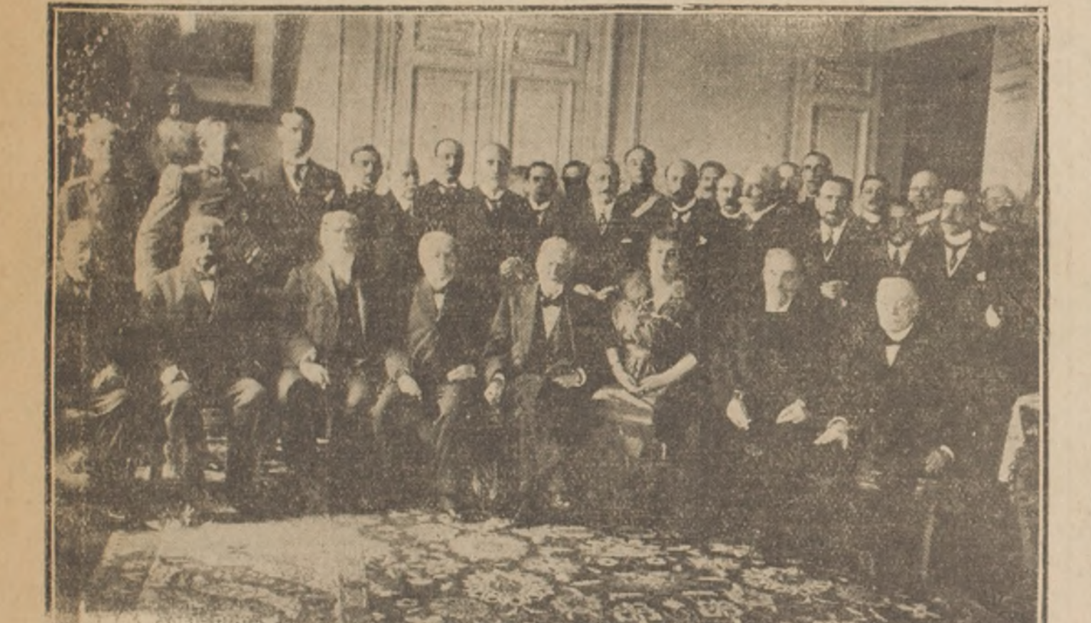
En la Legación Argentina. Asistentes al almuerzo

El Ministerio de Hacienda ha ordenado la promulgación de la ley que concede la rebaja a que se refiere el art. 28 de la ley N.º 3099 de 13 de Abril de 1916 y en la forma que ese artículo determina a los imponentes de la Caja de Ahorros de Empleados Públicos, de la Caja de Ahorros de los Ferrocarriles del Estado y de la Sociedad Protección Mutua de Empleados Públicos, sobre los gravámenes que tengan constituidos a favor de las instituciones nombradas, para la adquisición de propiedades, con arreglo a los estatutos de las mismas.