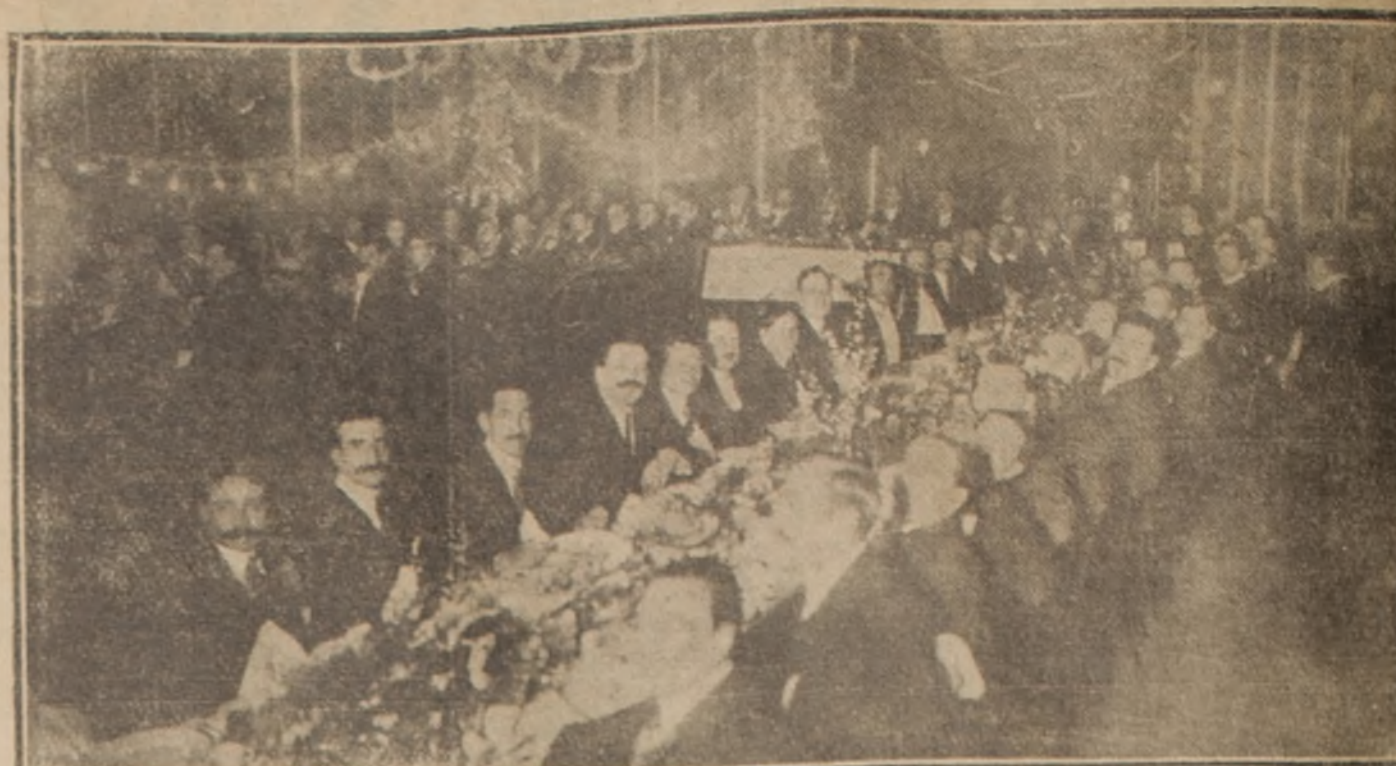
Celebración de su 7.º aniversario

Ayer celebró la Casa Gath y Chaves su 7.º aniversario. Es este establecimiento uno de los más grandes en su género y ha influido considerable y favorablemente en la prosperidad del comercio santiaguino.