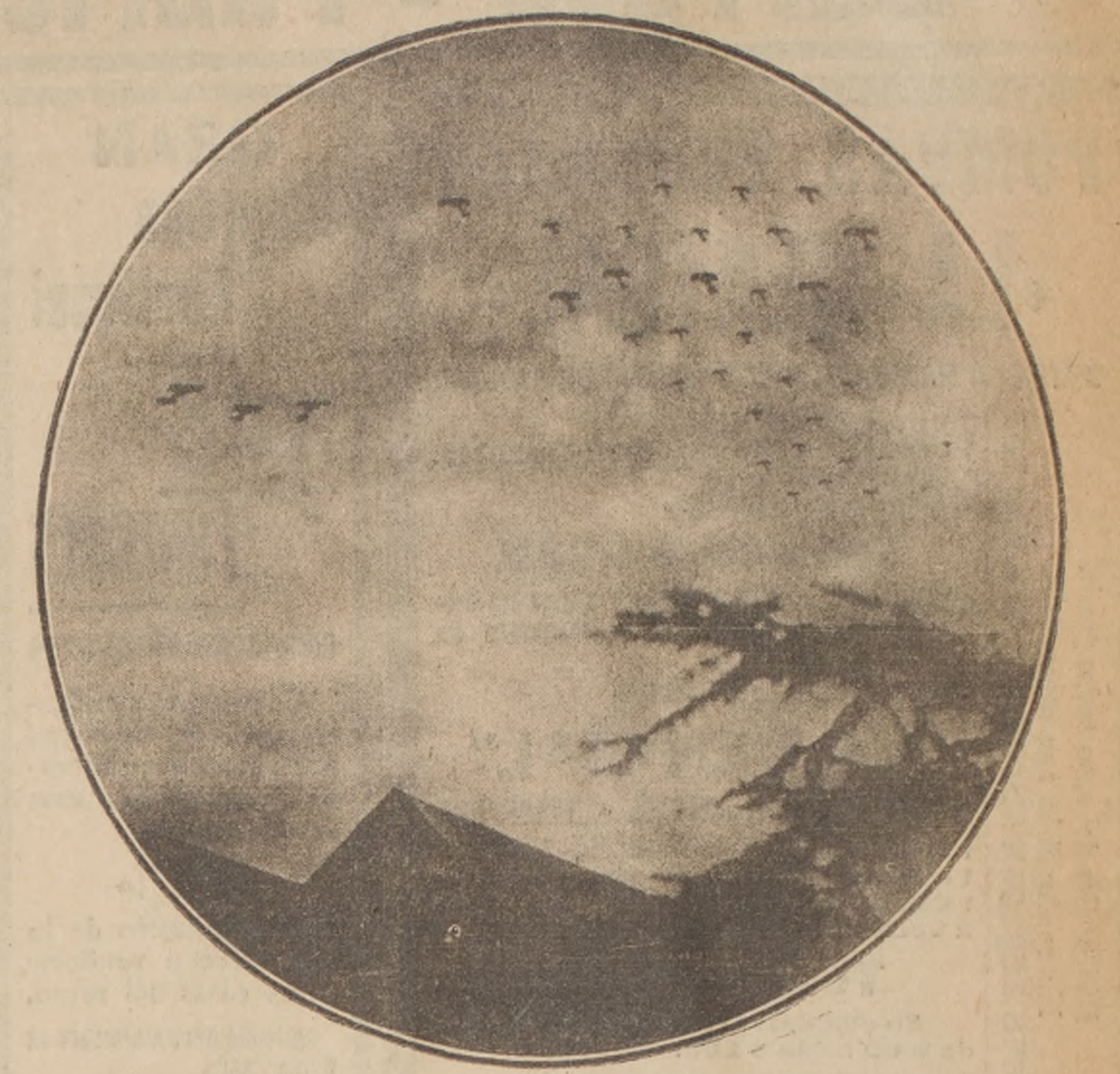
El día 7 de Julio hicieron los alemanes la excursión aérea más grande sobre Londres. Fueron 38 taubes los que operaron sobre la capital británica, matando a 37 personas y dejando 131 heridos. Tres taubes fueron inutilizados por los aeroplanos ingleses (tres de éstos se ven a la izquierda del grabado).