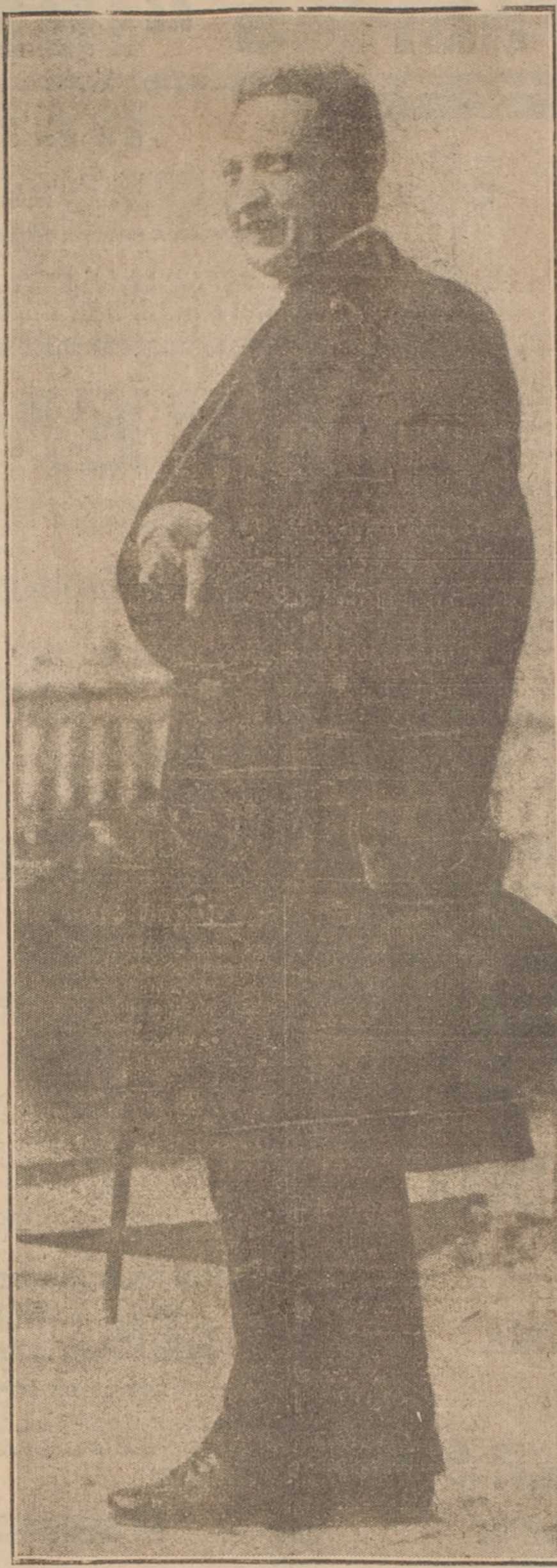
Hasta hace uno o dos días, Alexander Feodorovitch Kerensky era el «hombre» de Rusia; realidad en cuanto que obraba con energía y habilidad, y en cuanto que poseía el prestigio necesario a los caudillos y conductores de pueblos; esperanza, en cuanto que sus compatriotas, lo mismo que las potencias aliadas veían en él al torjador de la Rusia del porvenir. Pero parece que la vorágine lo va a tomar, a él también, entre sus ondas arremolinadas. Anuncian los cablegramas que el general Korniloff ha tomado camino de Petrogrado, resuelto a poner sitio a la capital rusa, a imponer (si puede) su autoridad a los actuales dirigentes del Gobierno, y a restaurar al Czar Nicolás en el trono. ¿Será el éxito de Kerensky transitorio y por lo mismo infecundo? ¿Qué suerte va a correr este joven improvisado por la guerra y en quien confiaba la mitad del mundo? De Kerensky dijo un escritor norteamericano: «De él depende la suerte de la nueva democracia.»