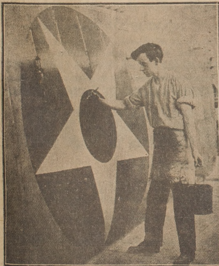
3.640.000.000 de dólares, no más, han sido destinados en los Estados Unidos para la construcción de aeroplanos de guerra. Serán estas máquinas enviadas a Europa. En las alas se ve la planta estrella.

fuente de nafta de la zona pérsica. Ya estos ensayos decisivos ponen de manifiesto el carácter agrícola de la vida económica turco-persa. casi sólo materias primas nos vienen de allá, y como productos industriales, únicamente sus alfombras. Apenas si pasa de industria doméstica la industria nacional: tejido de alfombras, telas, productos cerámicos y cigarros. En cambio de los productos naturales de Asia Anterior, envía allá Alemania las manufacturas de nuestra industria: telas, quincaillería, máquinas, aparatos eléctricos, productos químicos, cueros, etc.