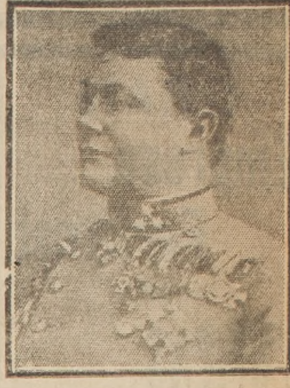
Dicen los cables que, en reemplazo del general Boroovitch, ha sido nombrado por el Emperador Carlos, comandante supremo de las fuerzas austro-húngaras, el general von Koevess.