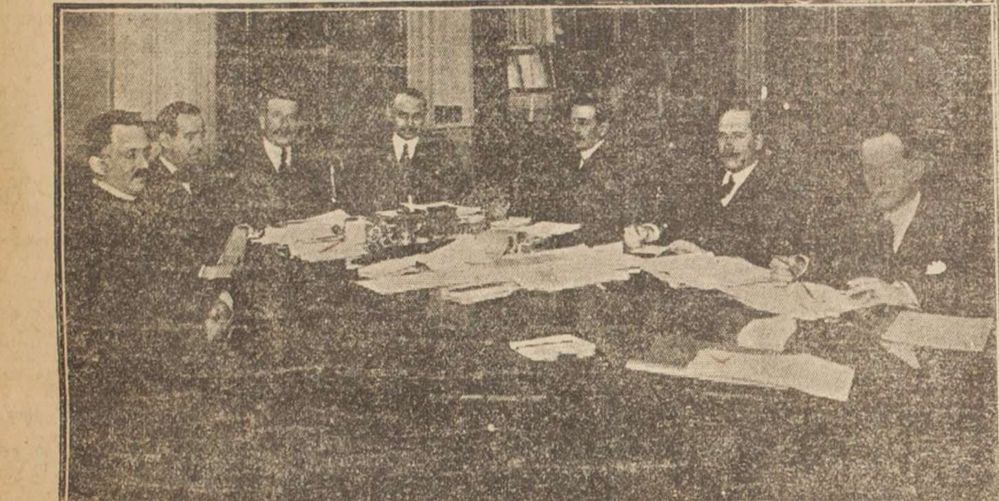
Comisión Internacional Chileno-Argentina, designada para estudiar el problema de las líneas de carga entre ambas secciones del Ferrocarril Transandino por Juncal. Sesión celebrada en Buenos Aires, en la cual se firmó el acta final.