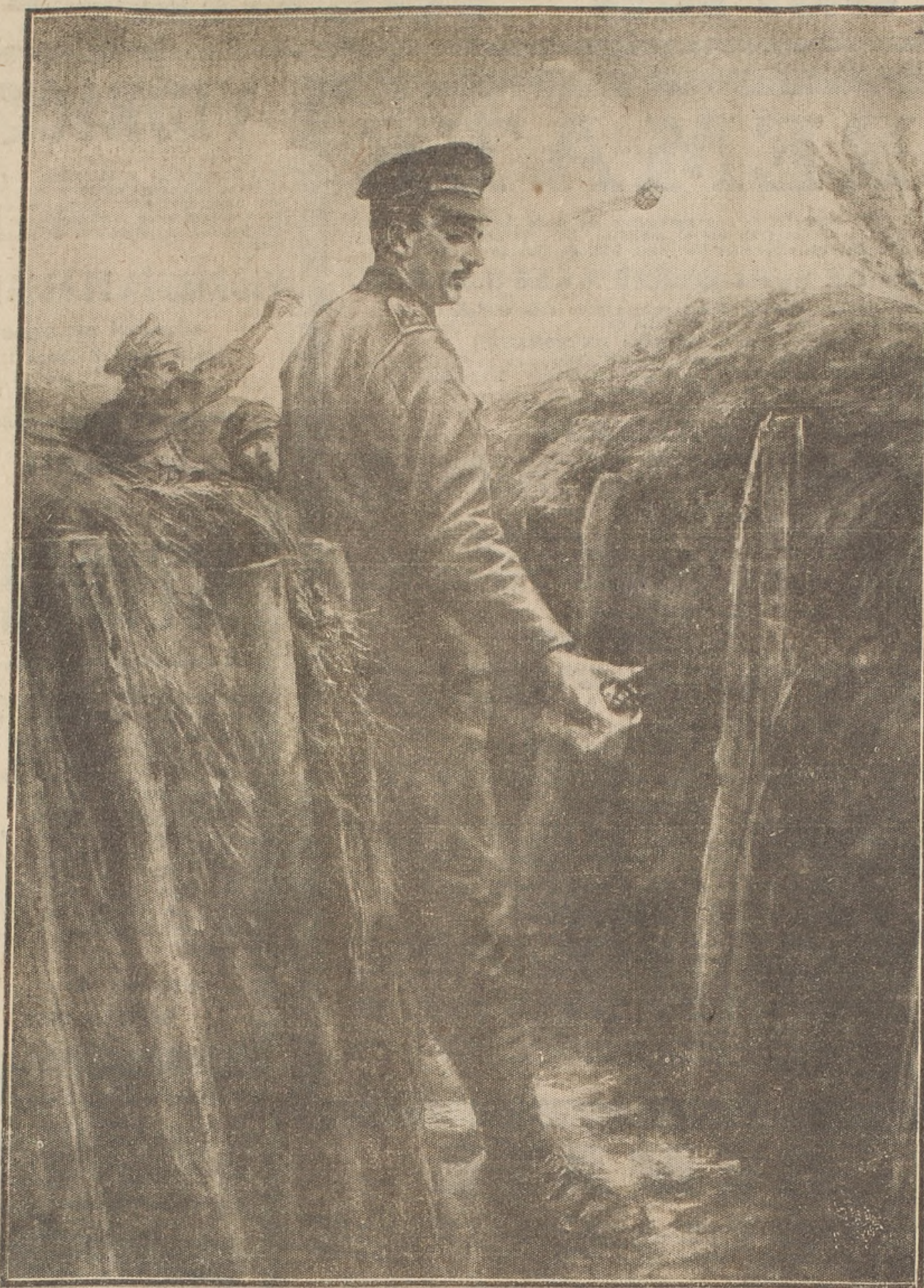
Tirar bombas al enemigo, no es cosa que pueda hacerla cualquier recluta; no. Si uno se arroja mucho en arrojando, la bomba caerá al campo enemigo sin estallar, y podrá ser empleada por los contrarios en sentido inverso. Por eso es que hay que contar los segundos necesarios entre el momento de disparar la bomba y el de dispararla. Es lo que está haciendo el soldado en la presente ilustración.