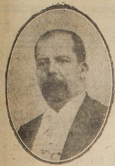
Don Manuel Estrada Cabrera, Presidente de Guatemala

Las cinco Repúblicas de la América hispana celebran al unísono la fecha de hoy como aniversario de su Independencia, conmemorando que el 15 de Septiembre de 1821 se firmó en Guatemala el acta que proclamara la cesación del dominio hispano, respecto de las provincias unidas de Centro América.